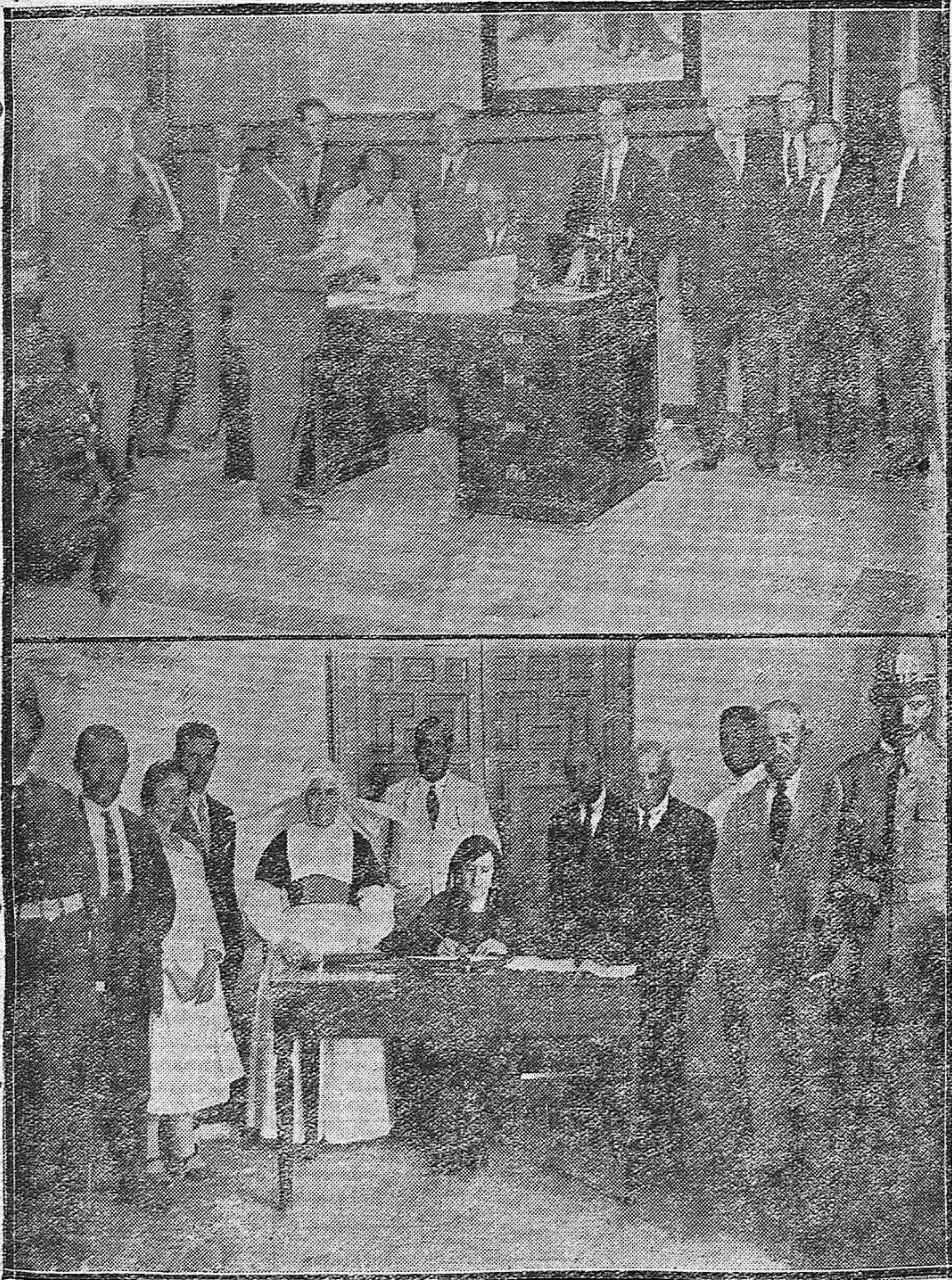
El Gobernador civil y otras distinguidas personalidades haciendo el recuento de firmas del plebiscito.--La mesa número 13 instalada en el Hospicio Provincial.