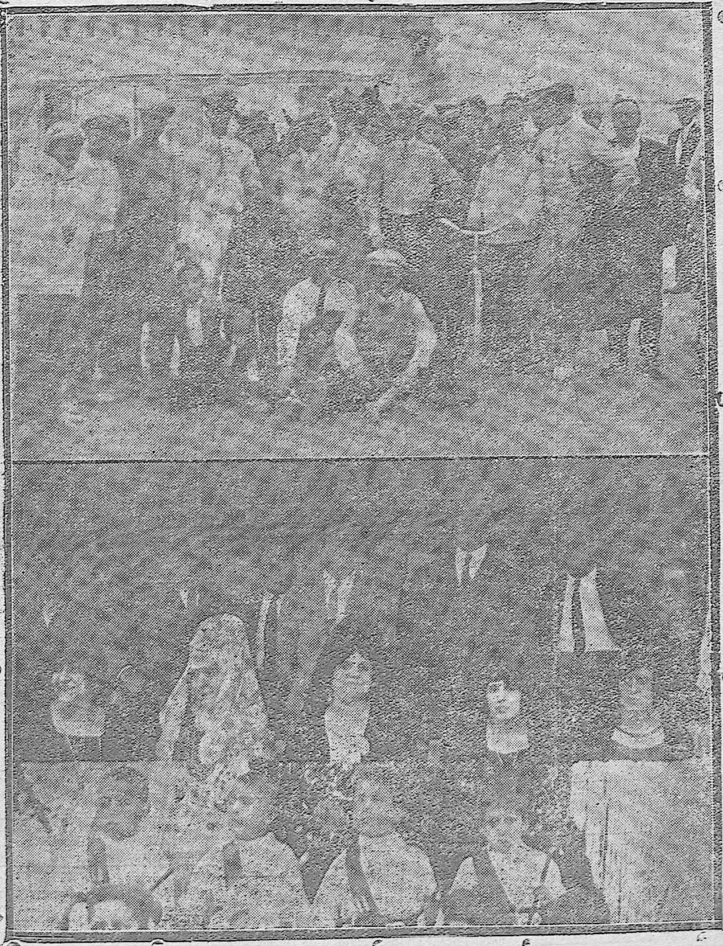
Empleados de la Electro-Mecánica que tomaron parte en a becerrada benéfica del domingo. Distinguidas damas y señoritas que presdieron el festejo.