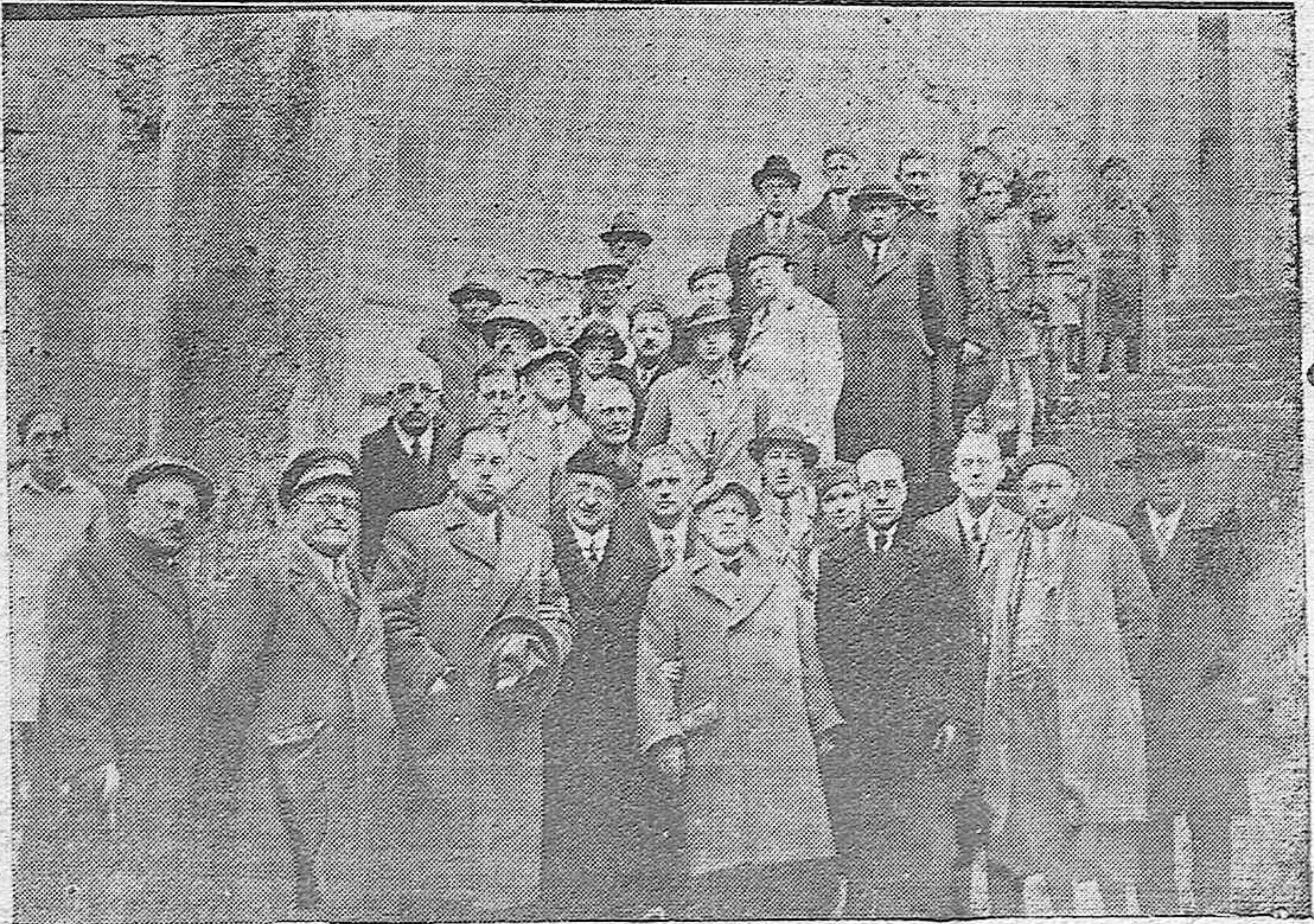
Los miembros del Congreso Internacional Antialcohólico durante la visita al Ayuntamiento de Córdoba, donde se celebró una recepción en su honor.—Los congresistas visitando los monumentos históricos de la ciudad