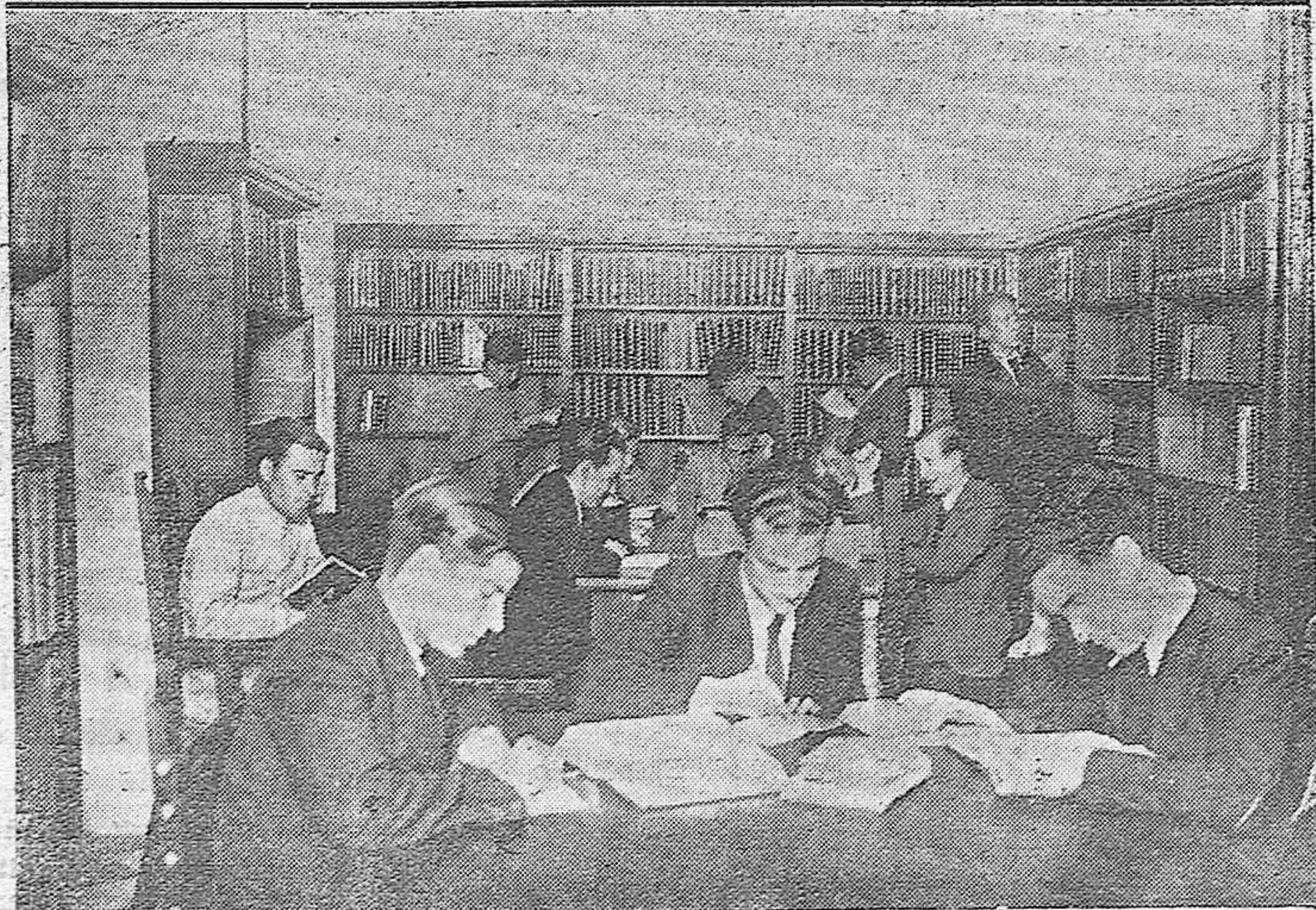
La Biblioteca Pública instalada en la parte baja de la Diputación Provincial a la que asisten diariamente gran número de estudiantes.—Dos aspectos de los salones de lectura