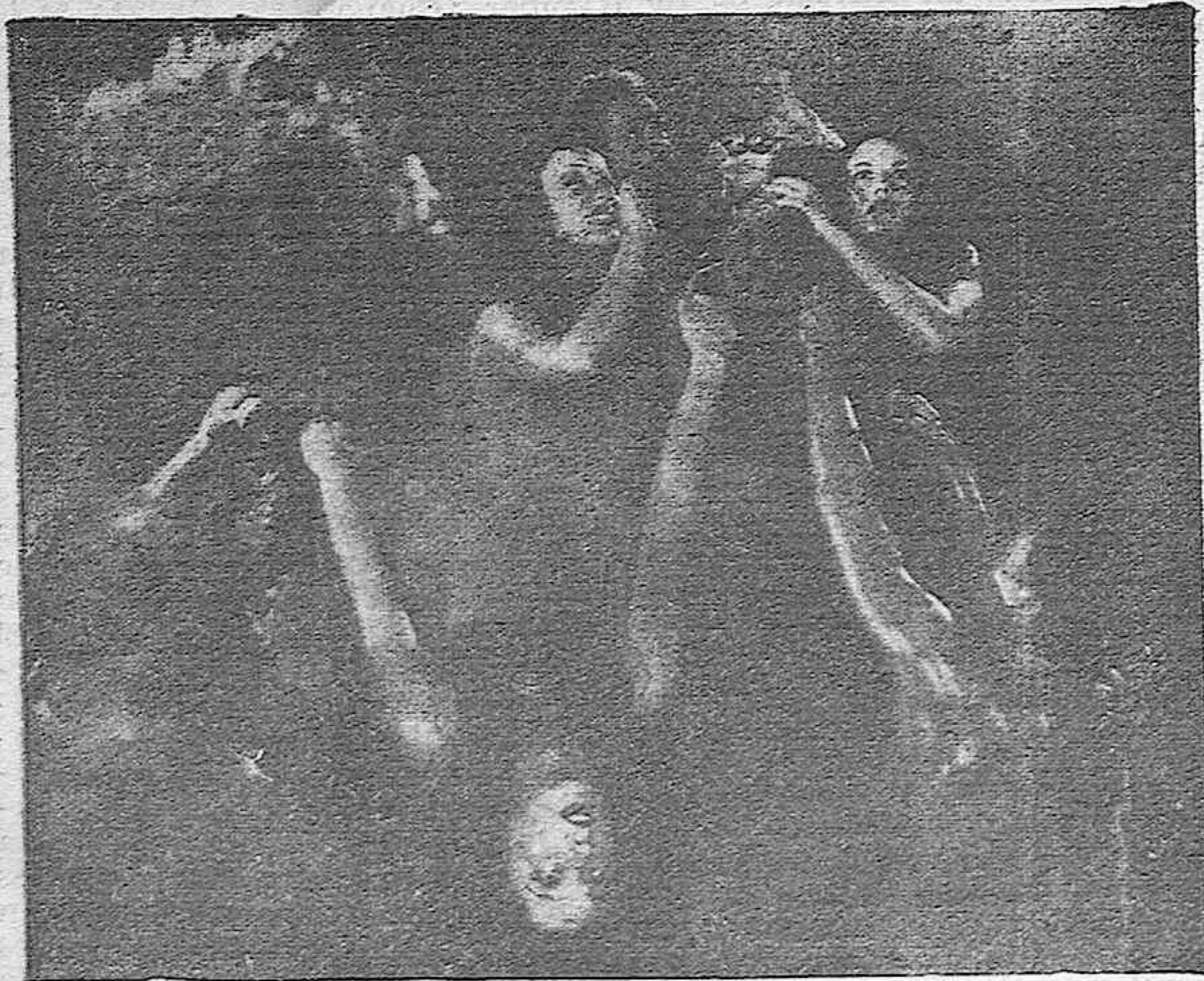
Una espectacular escena de la magnífica superproducción Fox, “La nave de Satán”, que se estrenó anoche en el Gran Teatro.