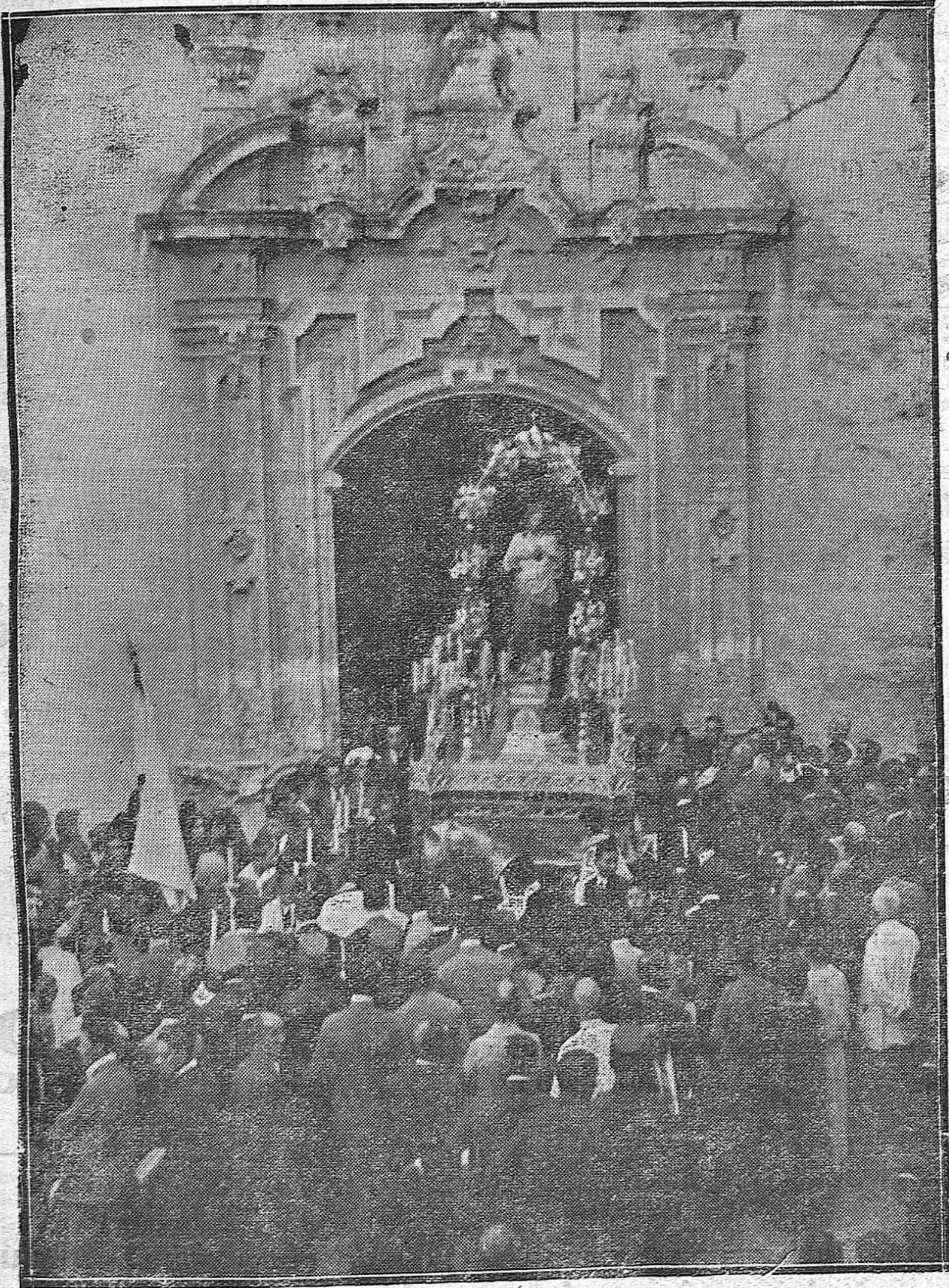
LA PROCESIÓN DE AYER.—LA IMAGEN DEL SAGRADO CORAZÓN DE JESÚS, AL SALIR DE LA REAL COLEGIATA DE SAN HIPÓLITO.