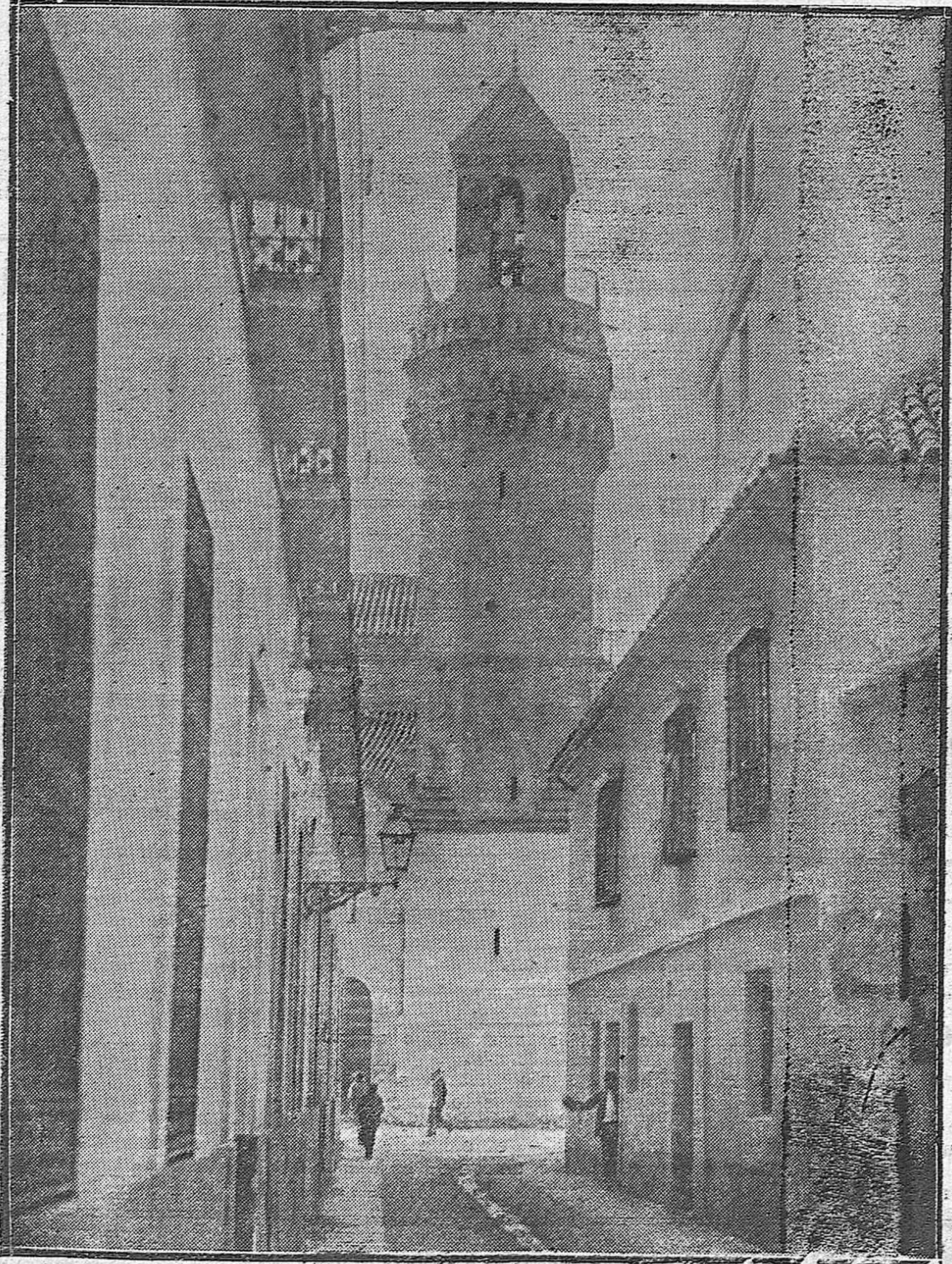
CORDOBA ARTISTICA.—UNA VISTA DE LA TORRE DE SAN NICOLÁS DE LA VILLA, LA MÁS GALLARDA MUESTRA DE LA ARQUITECTURA DEL SIGLO XV.