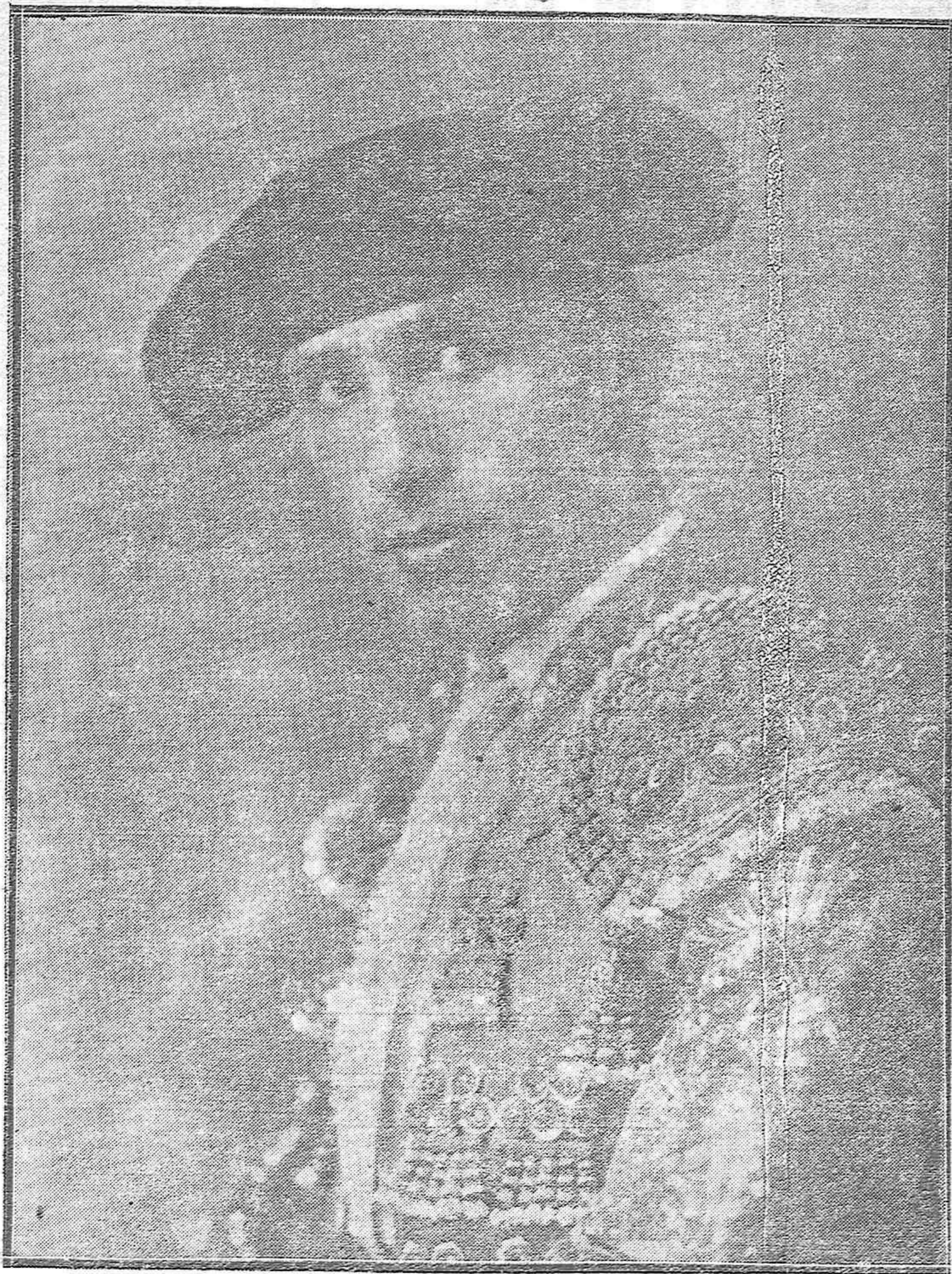
El matagrado matador de toros Juan Anillo "Nacional I.", víctima de la brutal agresión ocurrida en Soria cuando se celebraba una corrida.