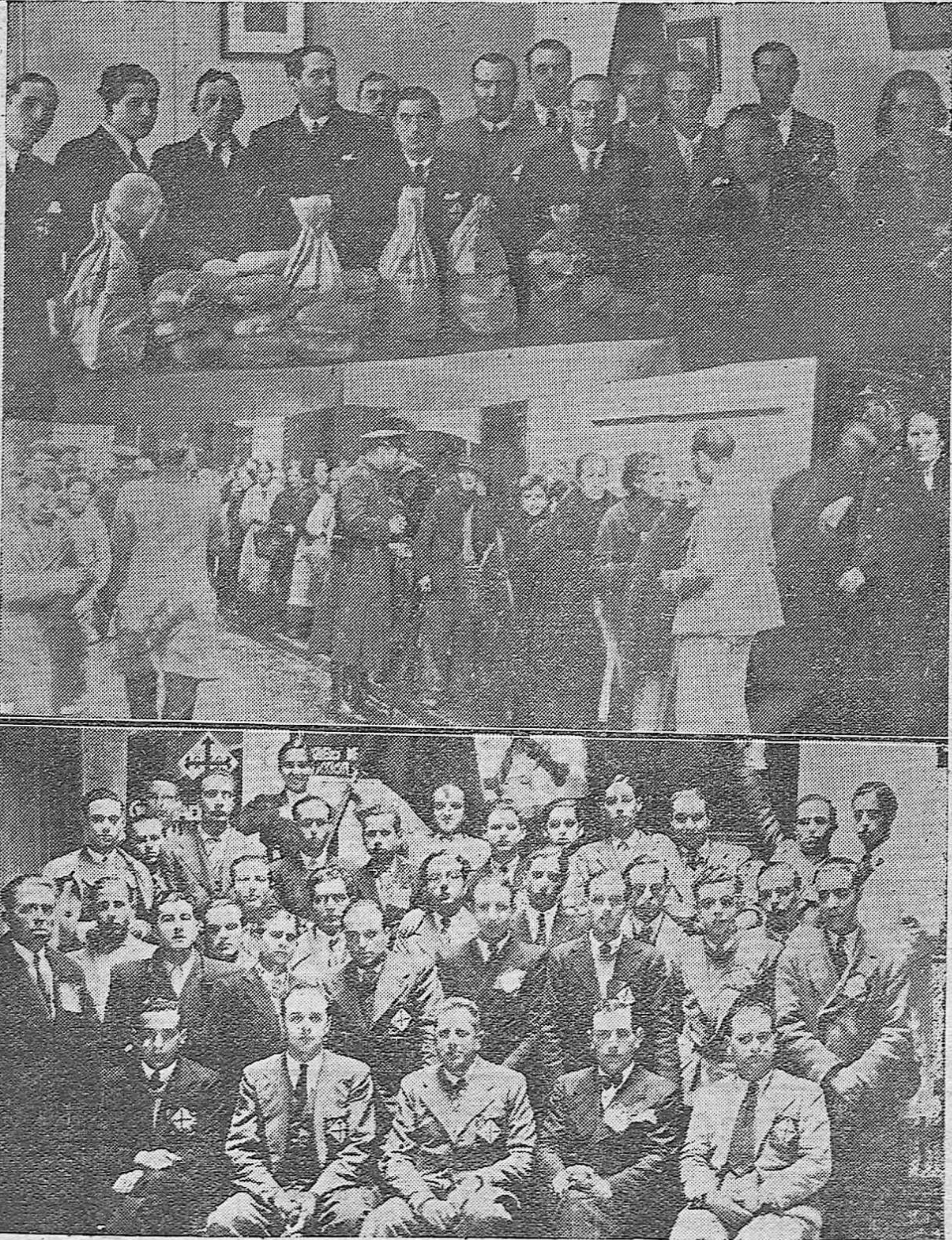
Reparto de dos mil comidas a familias necesitadas en el local de Acción Popular.—La "cola" formada para penetrar en el local de Acción Popular durante el reparto.—El cuarto grupo de defensa de la Juventud de Acción Popular encargada del orden.