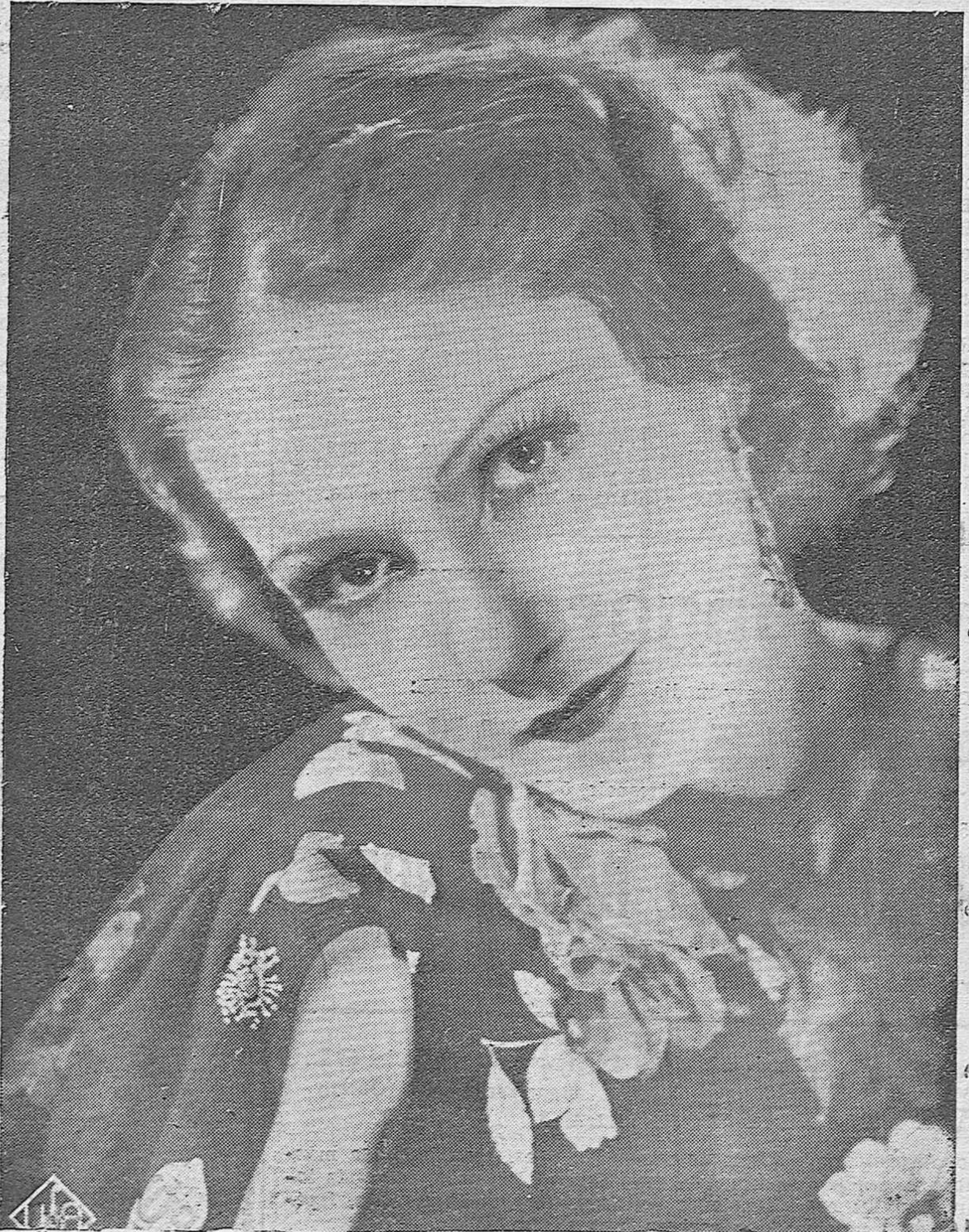
La bellissima actriz cinematográfica de la "Ufa" Brigitte Horney.