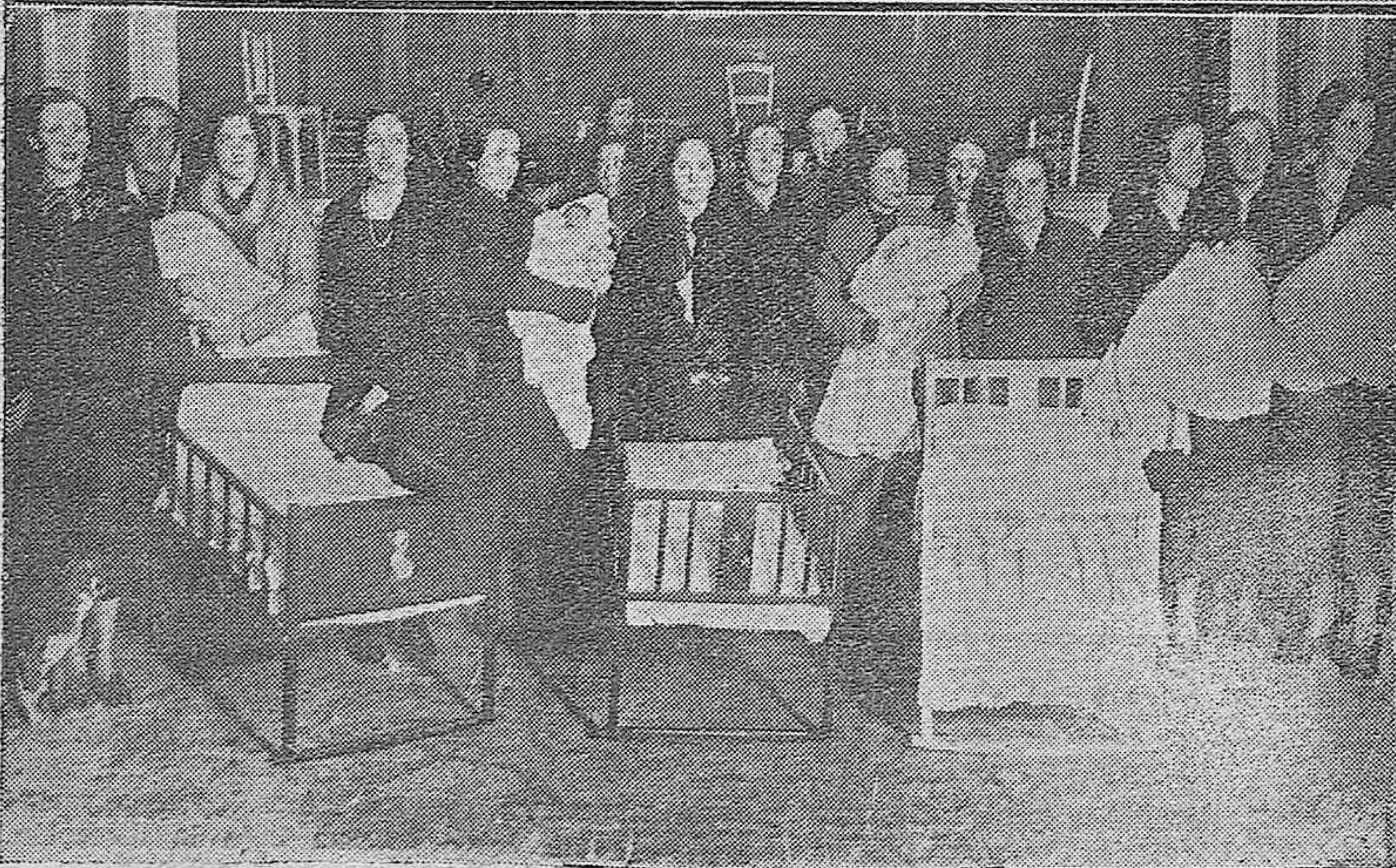
En el teatro de la calle de Valladares tuvo lugar la entrega de cunas por las Damas Auxiliares del Ropero del Obrero a las familias que asisten a las clases y cuyo último hijo nació entre la fecha de Nochebuena y primero de año