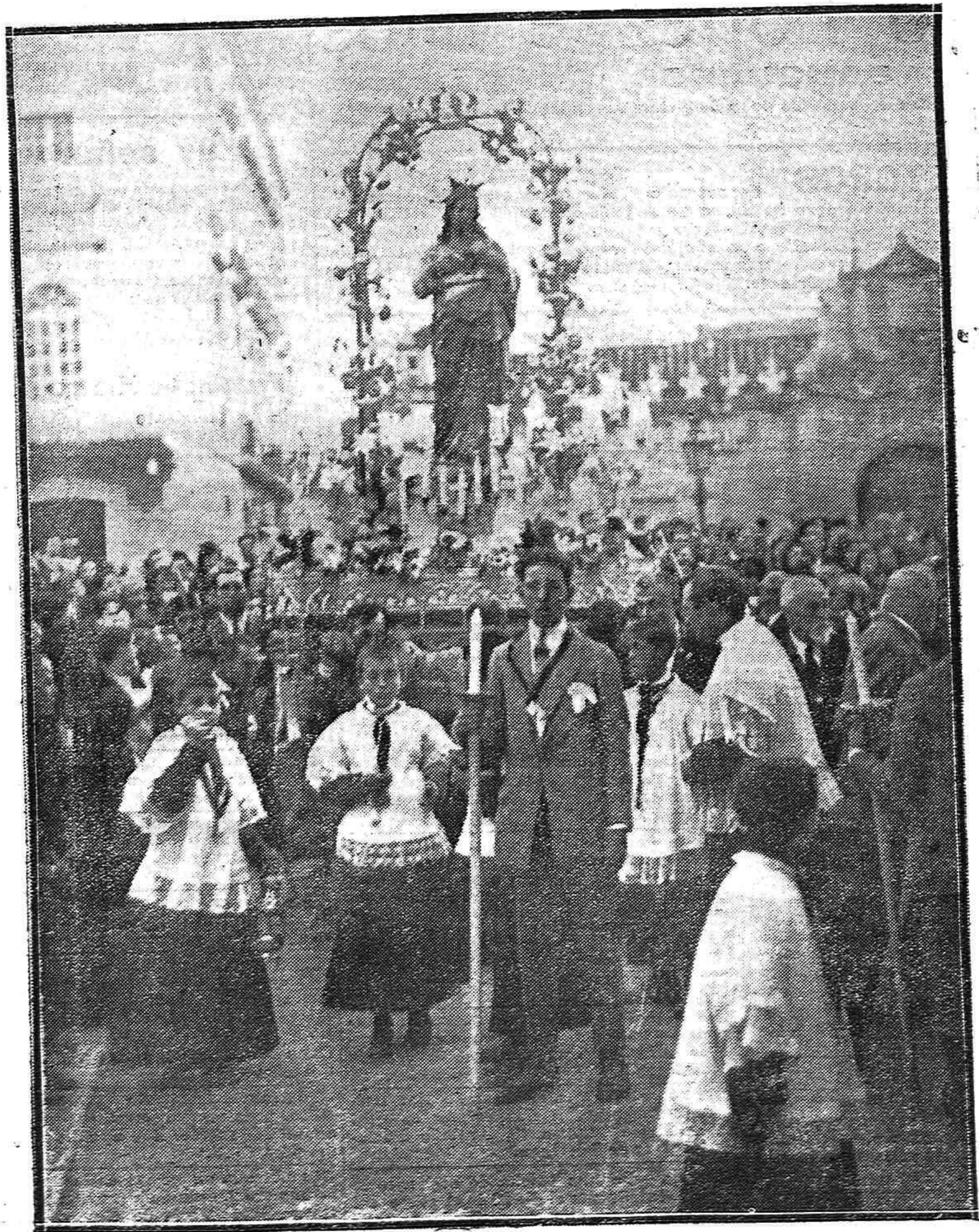
LA PROCESIÓN DE AYER.--La imagen del Sagrado Corazón de Jesús, que fué sacada procesionalmente ayer a su paso por el Gran Capitán.