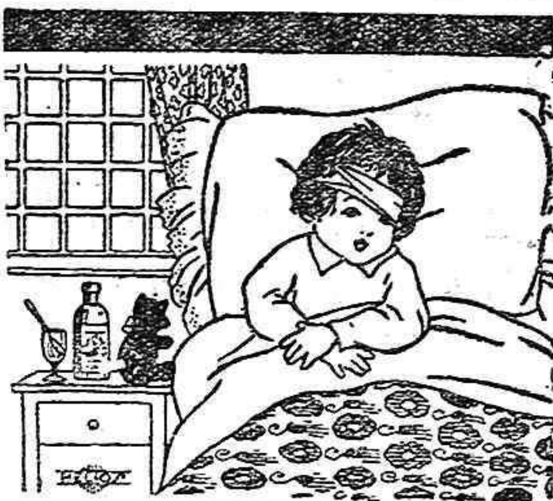
Manolito está en cama. ¿Qué tendrá Manolito?