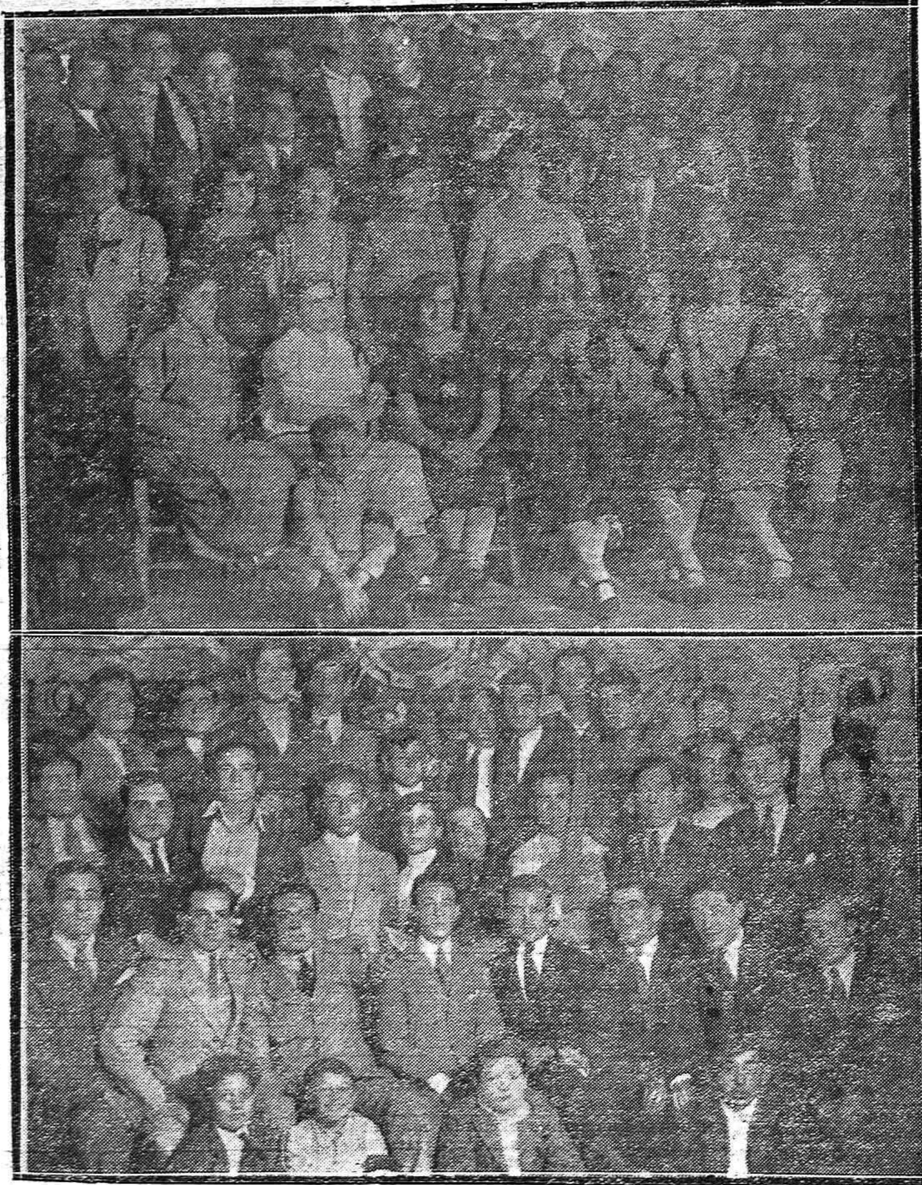
UNA VERBENA SIMPÁTICA.—Concurrentes a la velada organizada por la sociedad deportiva Nacional F. C. con motivo de la inauguración de su nuevo local.