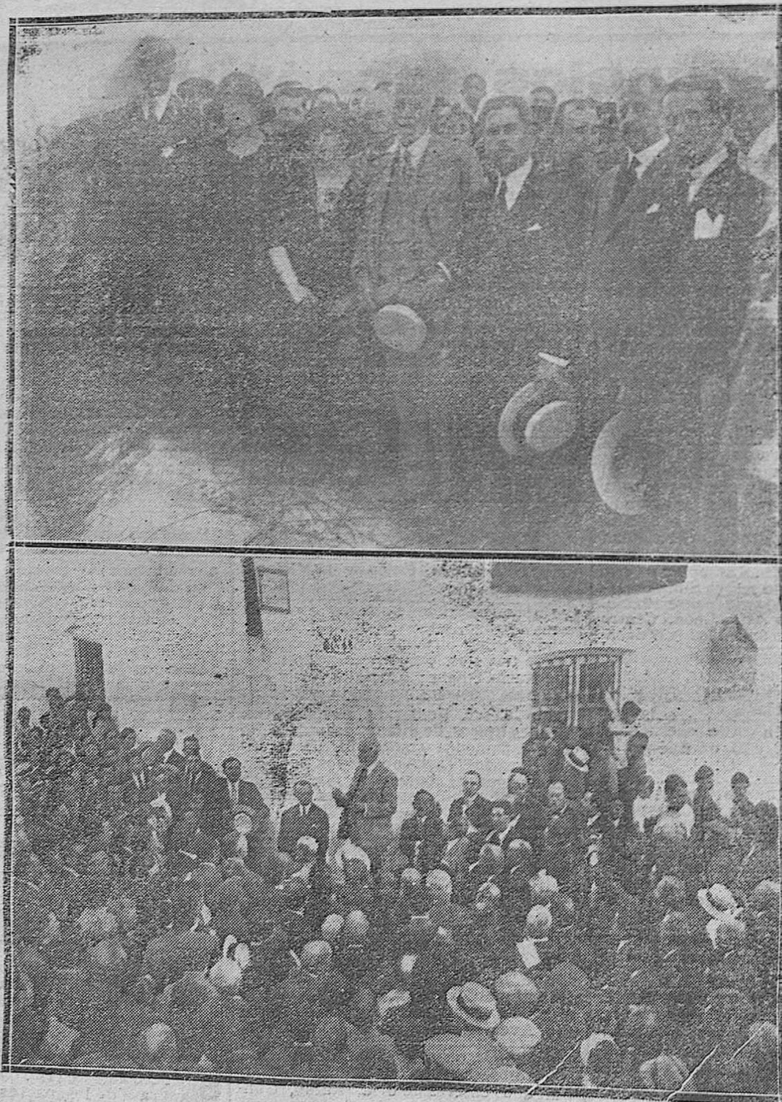
HOMENAJE A UN NOVELISTA ILUSTRE.—1) EL CELEBRADO AUTOR DE "LA HERMANA SAN SULPICIO" DON ARMANDO PALACIO VALDÉS, ACOMPAÑADO DE SU ESPOSA Y AUTORIDADES JIENENSES EN EL ACTO DEL DESCUBRIMIENTO DEL RÓTULO QUE DA SU NOMBRE A UNA DE LAS CALLES DE MARMOLERO.—2) EL INSIGNE NOVELISTA LEYENDO UNAS CUARTILLAS DE AGRADECIMIENTO AL PUEBLO POR EL HOMENAJE QUE SE LE TRIBUTABA.