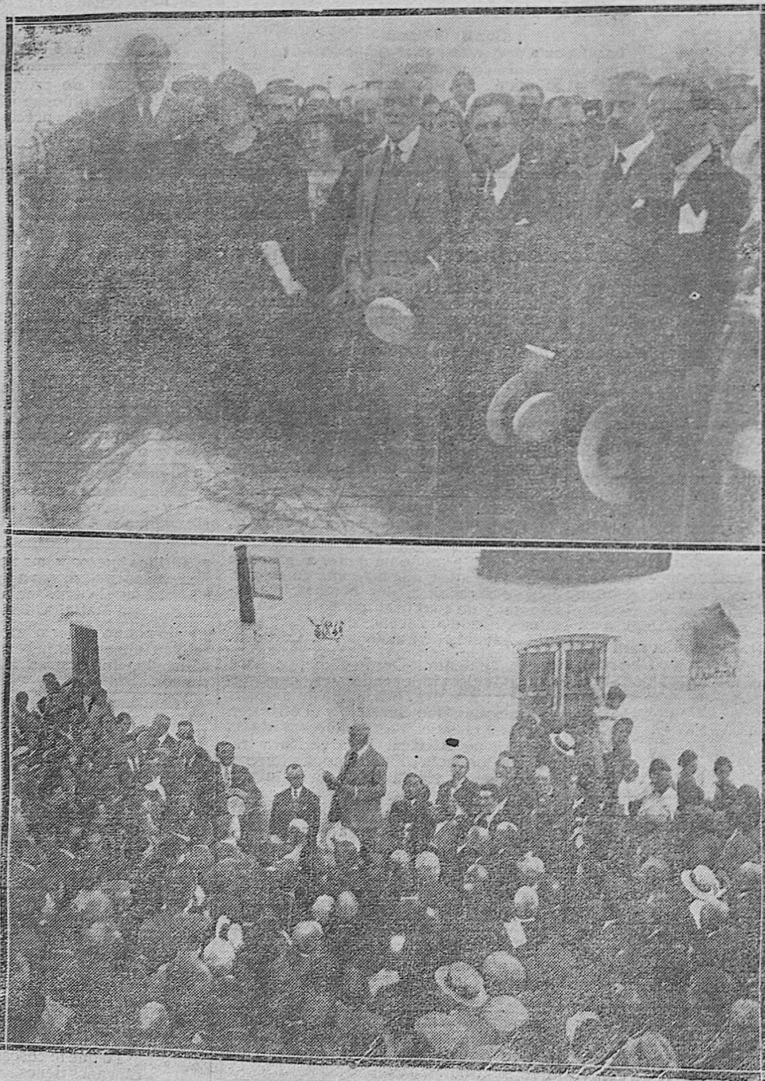
HOMENAJE A UN NOVELISTA ILUSTRE.—1) EL CELEBRADO AUTOR DE "LA HERMANA SAN SULPICIO" DON ARMANDO PALACIO VALDÉS, ACOMPAÑADO DE SU ESPOSA Y AUTORIDADES JIENENSES EN EL ACTO DEL DESCUBRIMIENTO DEL RÓTULO QUE DA SU NOMBRE A UNA DE LAS CALLES DE MARMOLEJO.—2) EL INSIGNE NOVELISTA LEYENDO UNAS CUARTILLAS DE AGRADECIMIENTO AL PUEBLO POR EL HOMENAJE QUE SE LE TRIBUTABA.