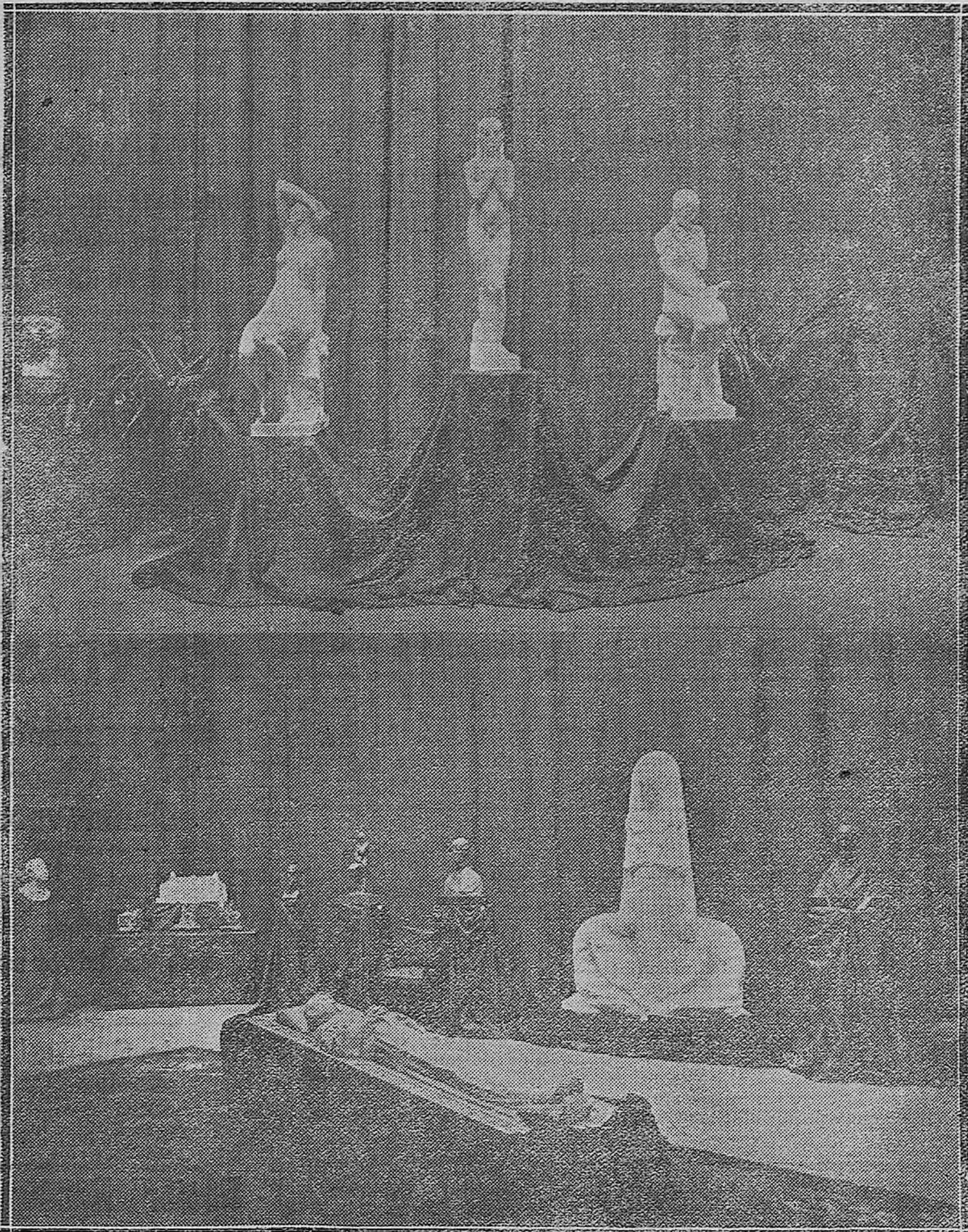
DE LA EXPOSICIÓN INURRIA QUE EL DOMINGO SE CLAUSURO EN MADRID.—Dos salas de dicha exposición.