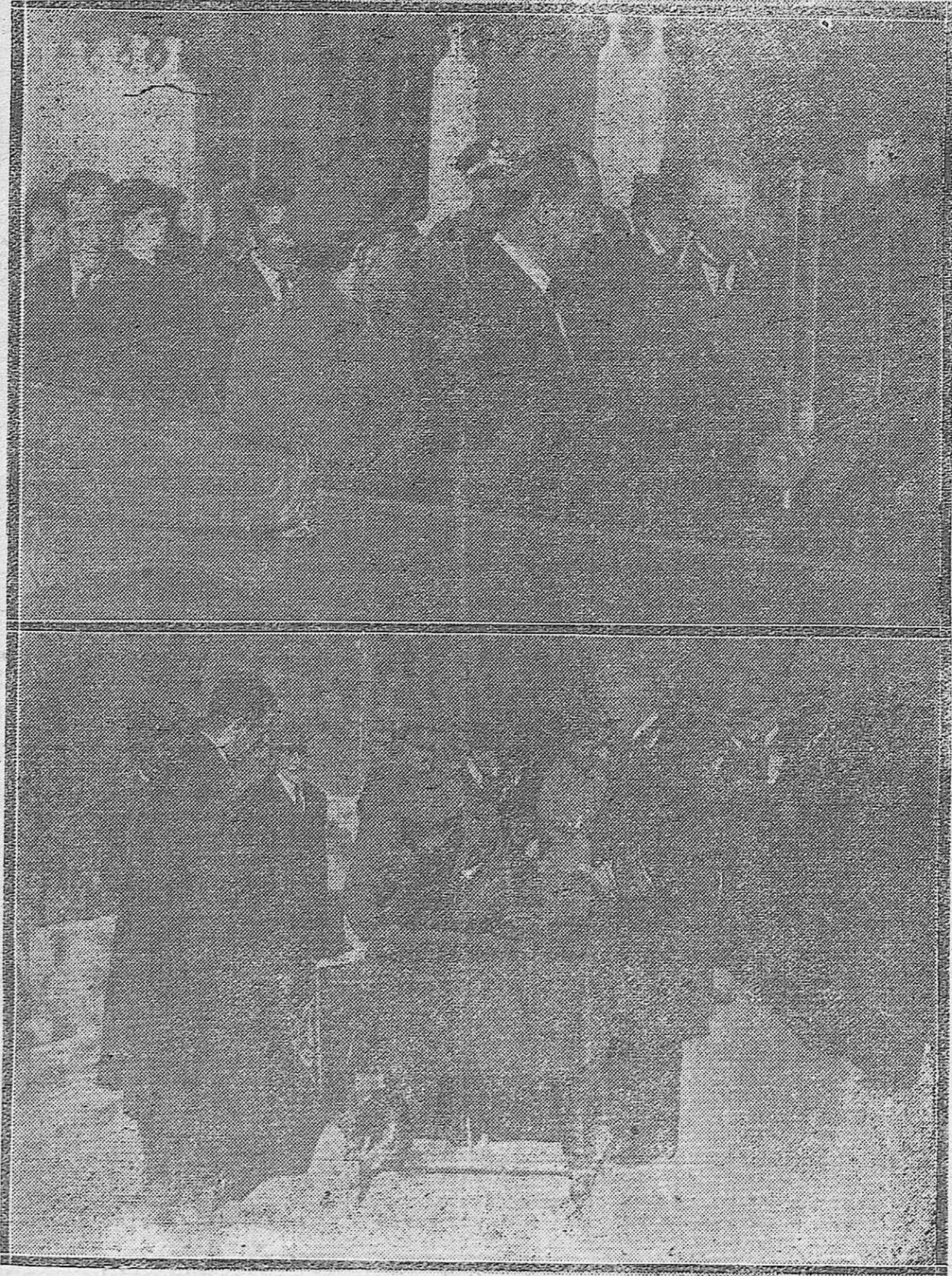
1) Don Alfonso XIII al subir al automóvil acompañado del alcalde de la ciudad señor Cruz Conde a su llegada a Córdoba.—2) Su Majestad el Rey firmando el pergamino que recordará su visita a las obras del pantano del Guadalmellato.