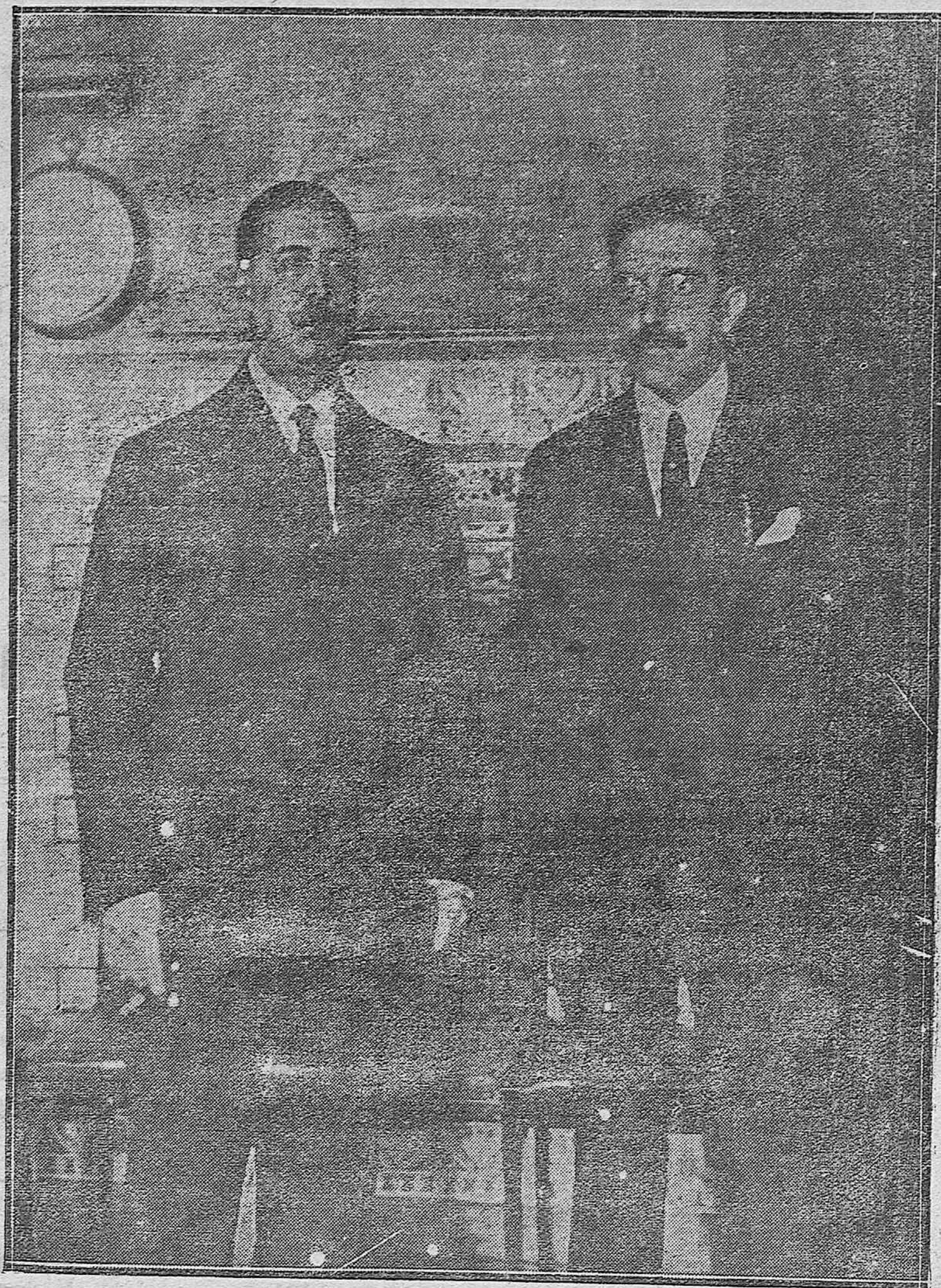
EL GOBERNADOR MILITAR HACIENDO ENTREGA AL PRESIDENTE DE LA AUDIENCIA DEL MANDO DE LA PROVINCIA.