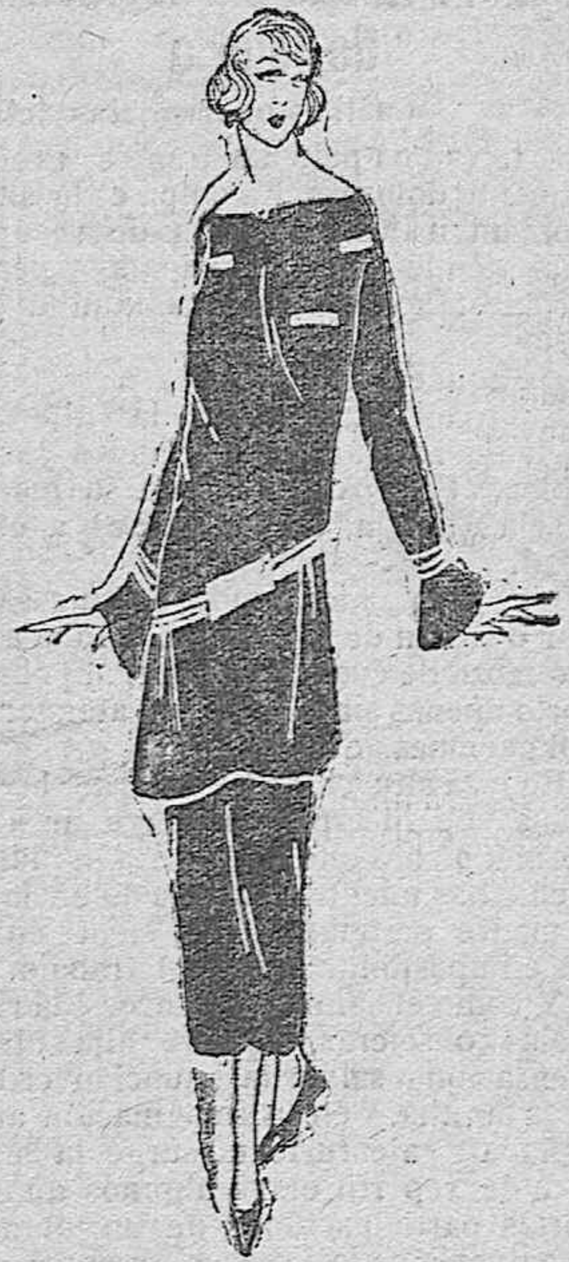
faldón en forma a'ornada con burrele- tes de terciopelo blanco dispuestos con arte.

Zócalos de azulejos en diferentes tamaños, clases y dibujos Tuberías de semi-gres y gres legitimo