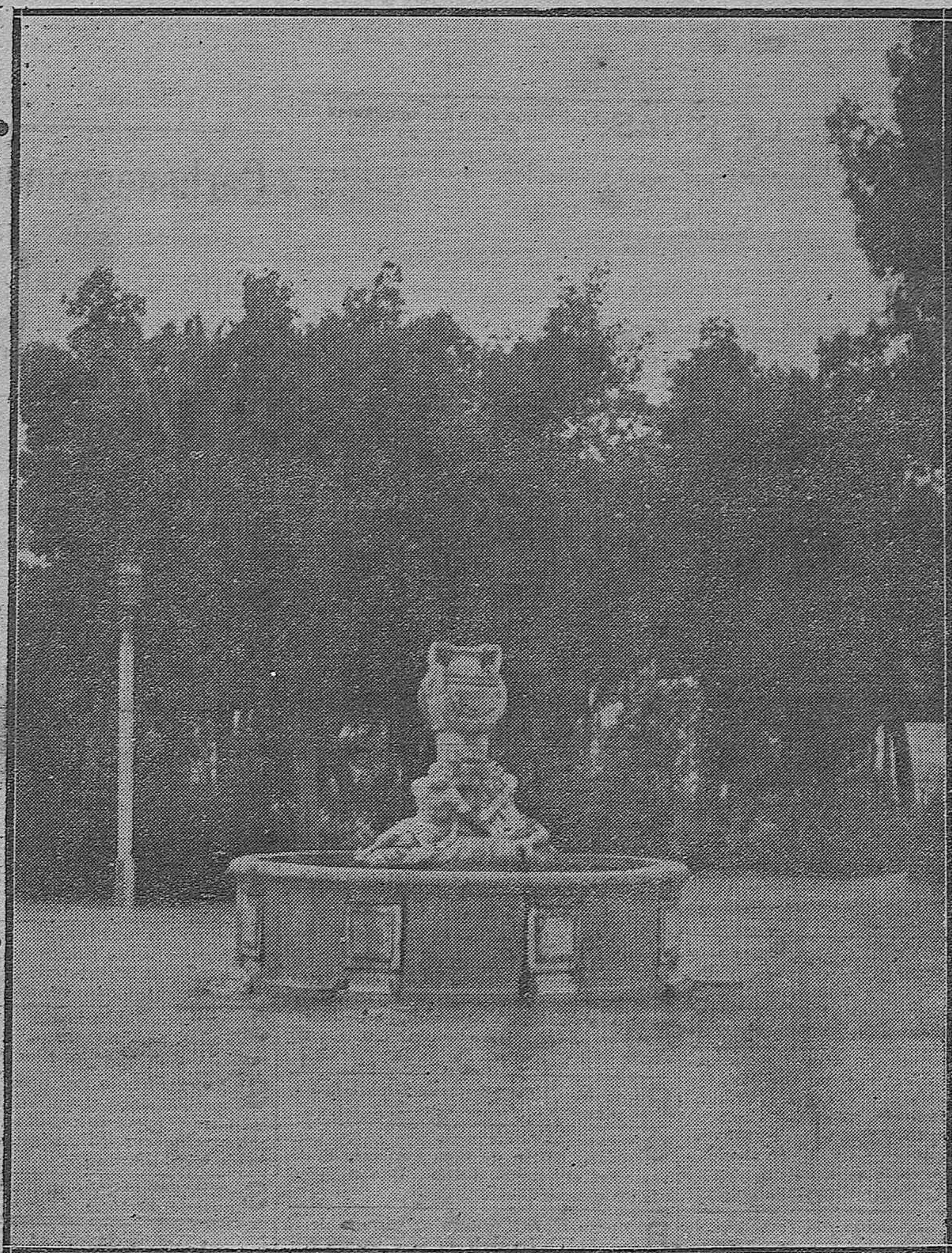
LOS JARDINES DEL DÜQUE DE RIVAS.-Primorosa fuente que constituyo el más artistico adorno de aquel ameno paraje.