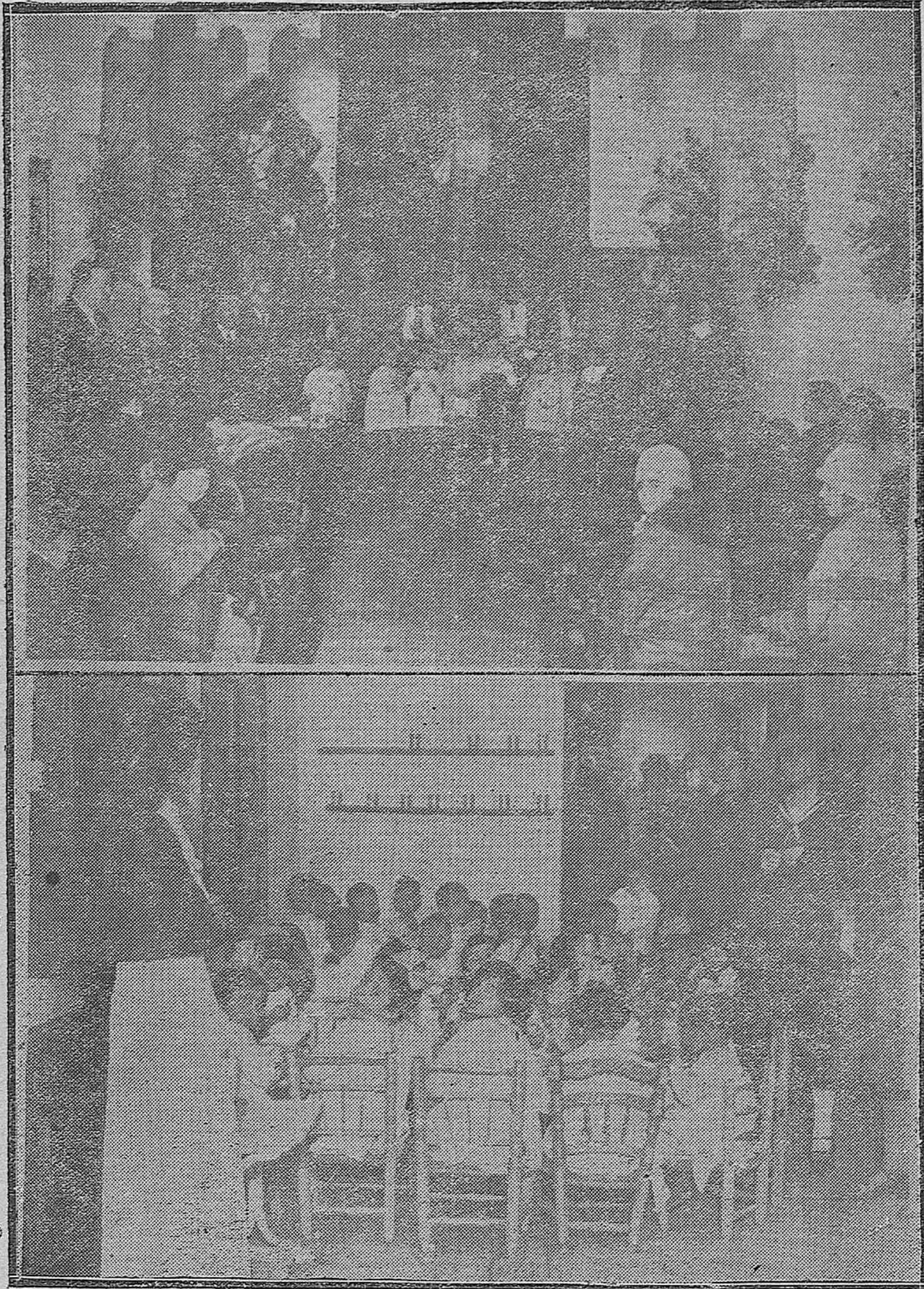
EN LA CASA DEL NIÑO.--1) Momento del reparto de prendas y juguetes a los niños, a presencia de las autoridades.--2) Los acogidos, durante la merienda con que fueron obsequiados.