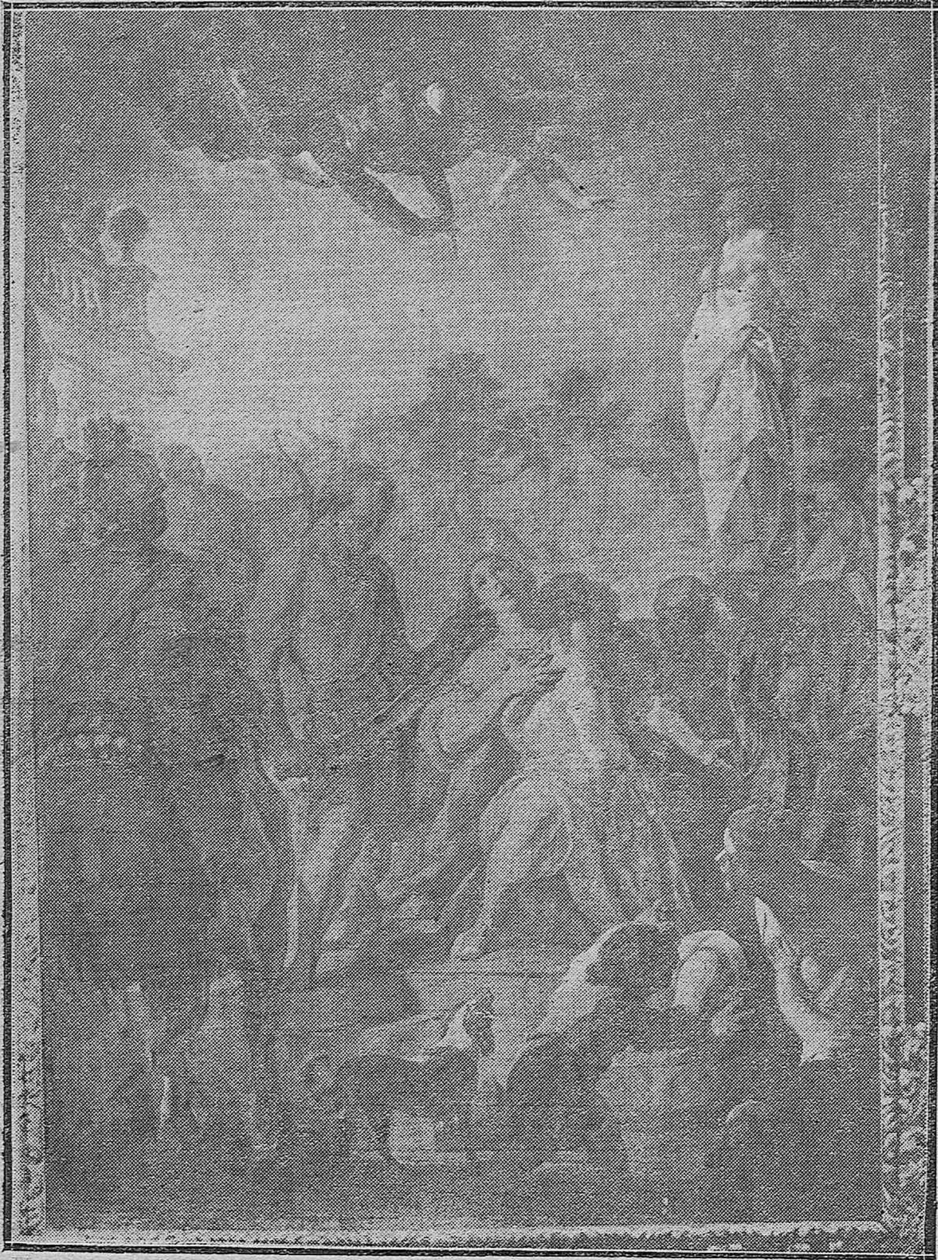
Notable cuadro del pintor Faomino