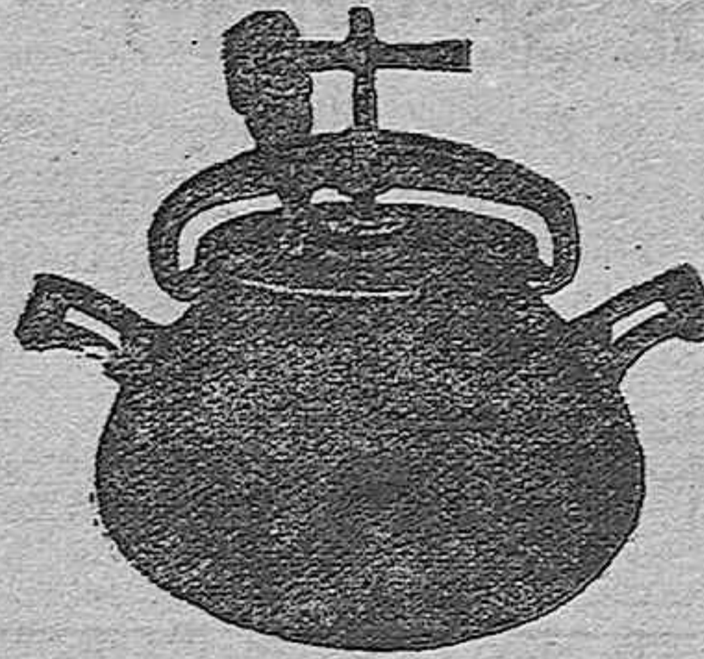
Marmita Hispano-Olla Exprés

Batería de cocina - Herrajes para obras y herramientas en general