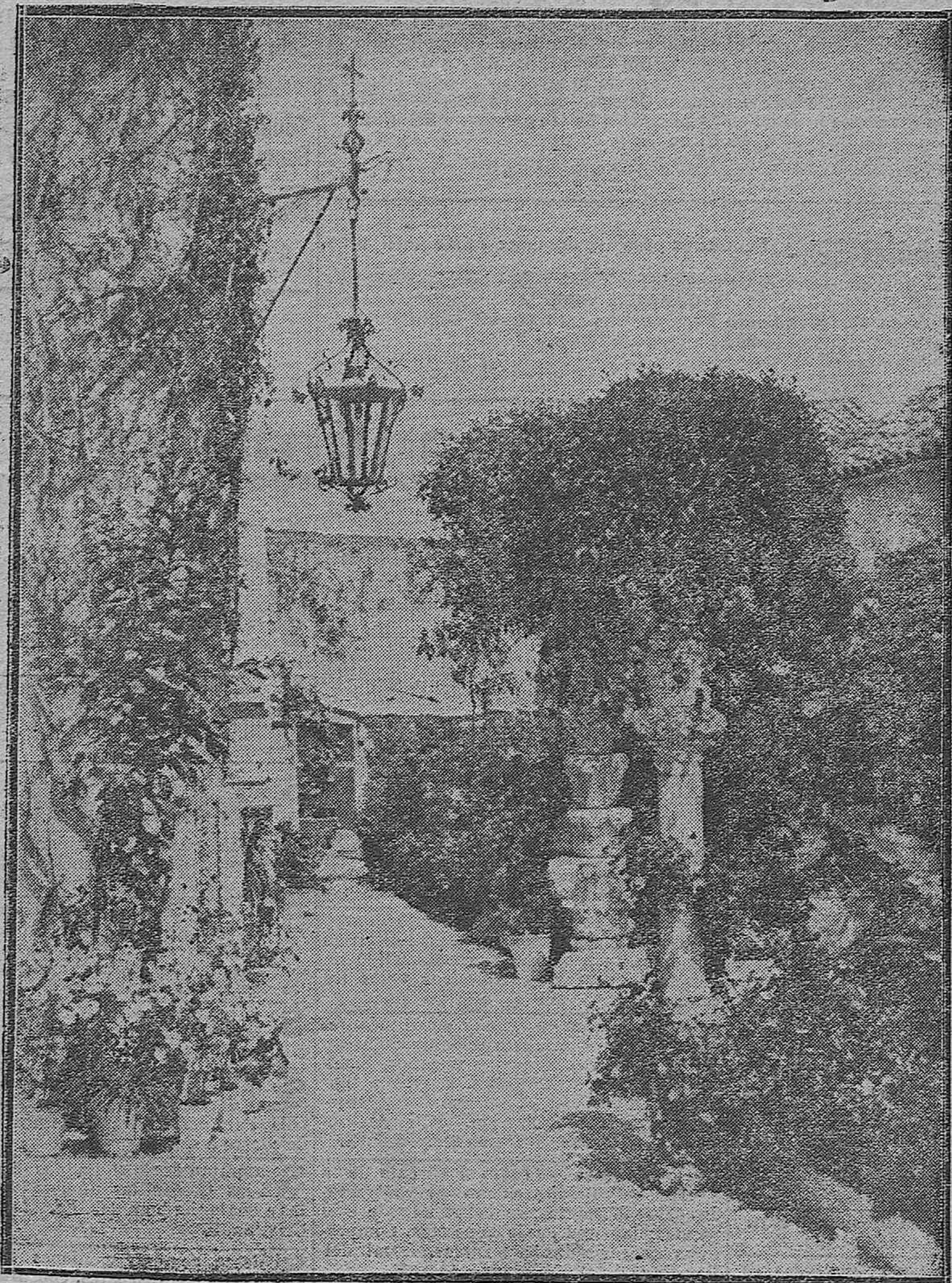
LOS JARDINES DE CÓRDOBA.--Pintoresco rincón del de los Romero de Torres.