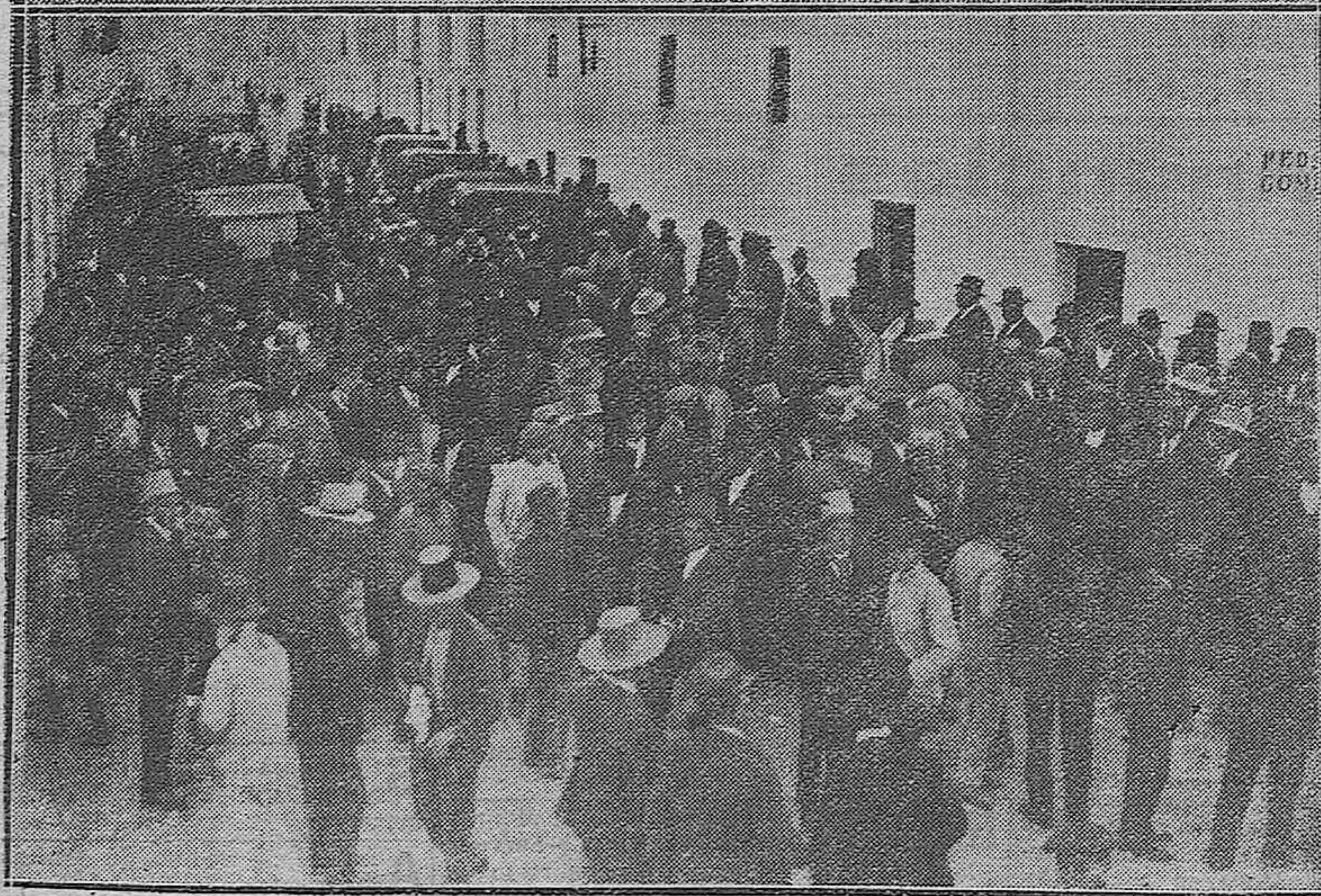
EL MITIN AGRARIO DE FERNÁN-NÚÑEZ.—1) Las comisiones de los distintos pueblos que en el lugar denominado Los Tejares, esperaban a los oradores.—2) Aspecto de la calle José Canalejas a la terminación del mitin.