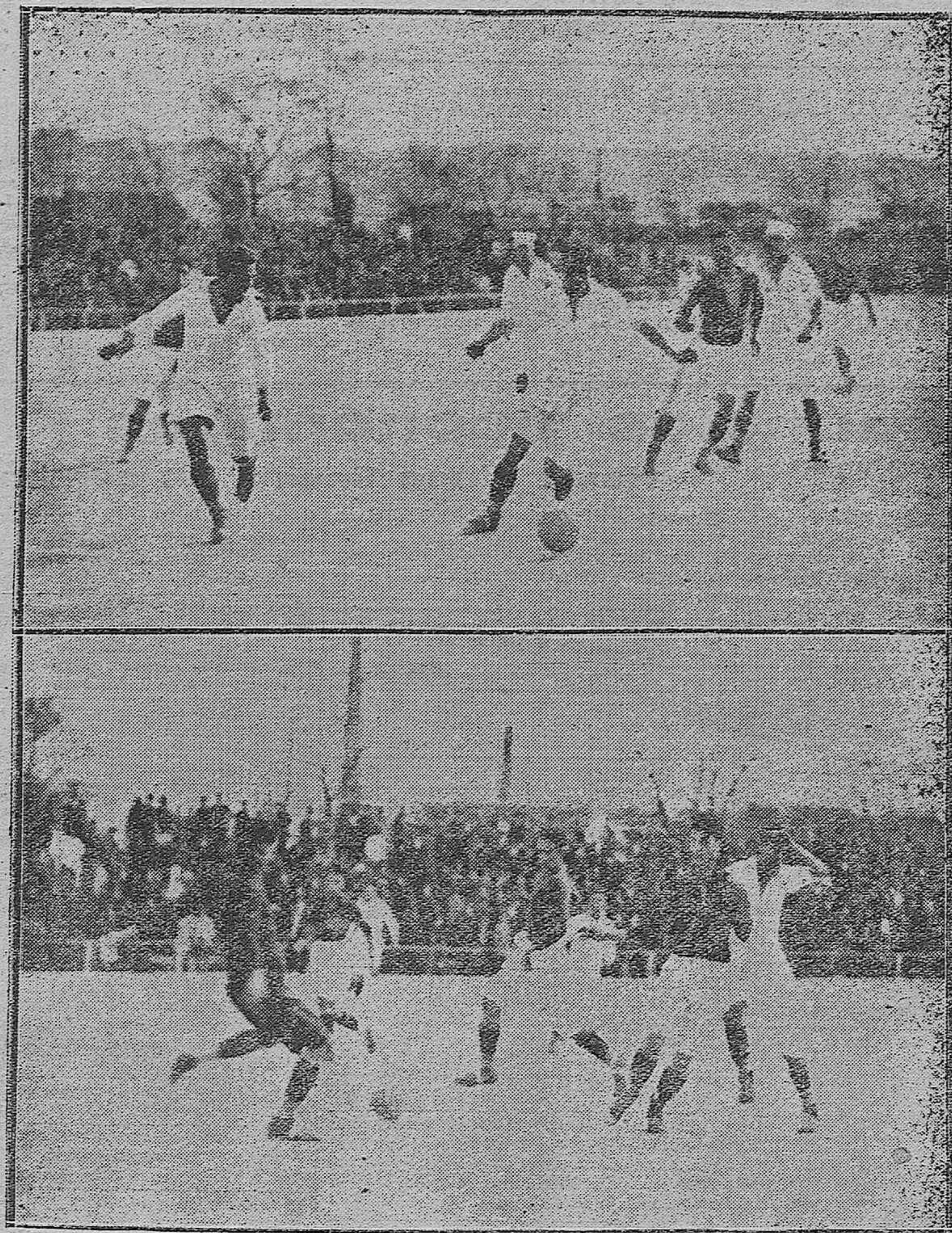
NOTAS GRÁFICAS DEPORTIVAS.--Dos momentos interesantes del partido de fútbol jugado el domingo entre los equipos San Román F. C., de Sevilla y Real Córdoba Sporting Club, que empataron a dos tantos. Dicho encuentro, por su técnica, finura y delicadeza dejará grato recuerdo entre los amantes de este deporte.