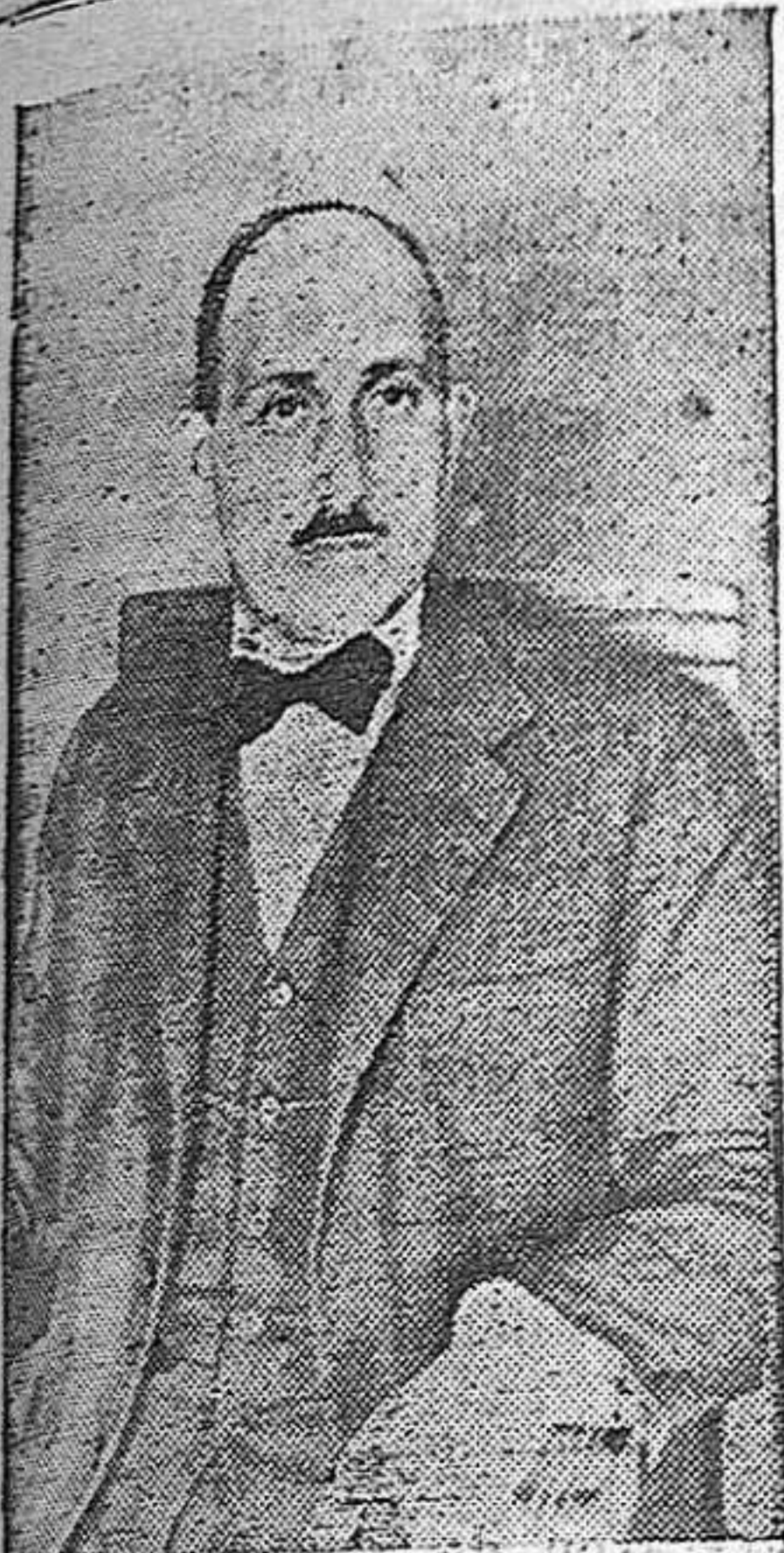
EL JUEZ DE INSTRUCCIÓN DEL DISTRITO DE LA IZQUIERDA DON EDUARDO PORTAS, QUE CON CELO EXTRAORDINARIO INSTRUYE LAS DILIGENCIAS EN EL CASO SERRANO POR EL DOBLE ASESINATO DE LOS AMEULANTES DE COPREOS.