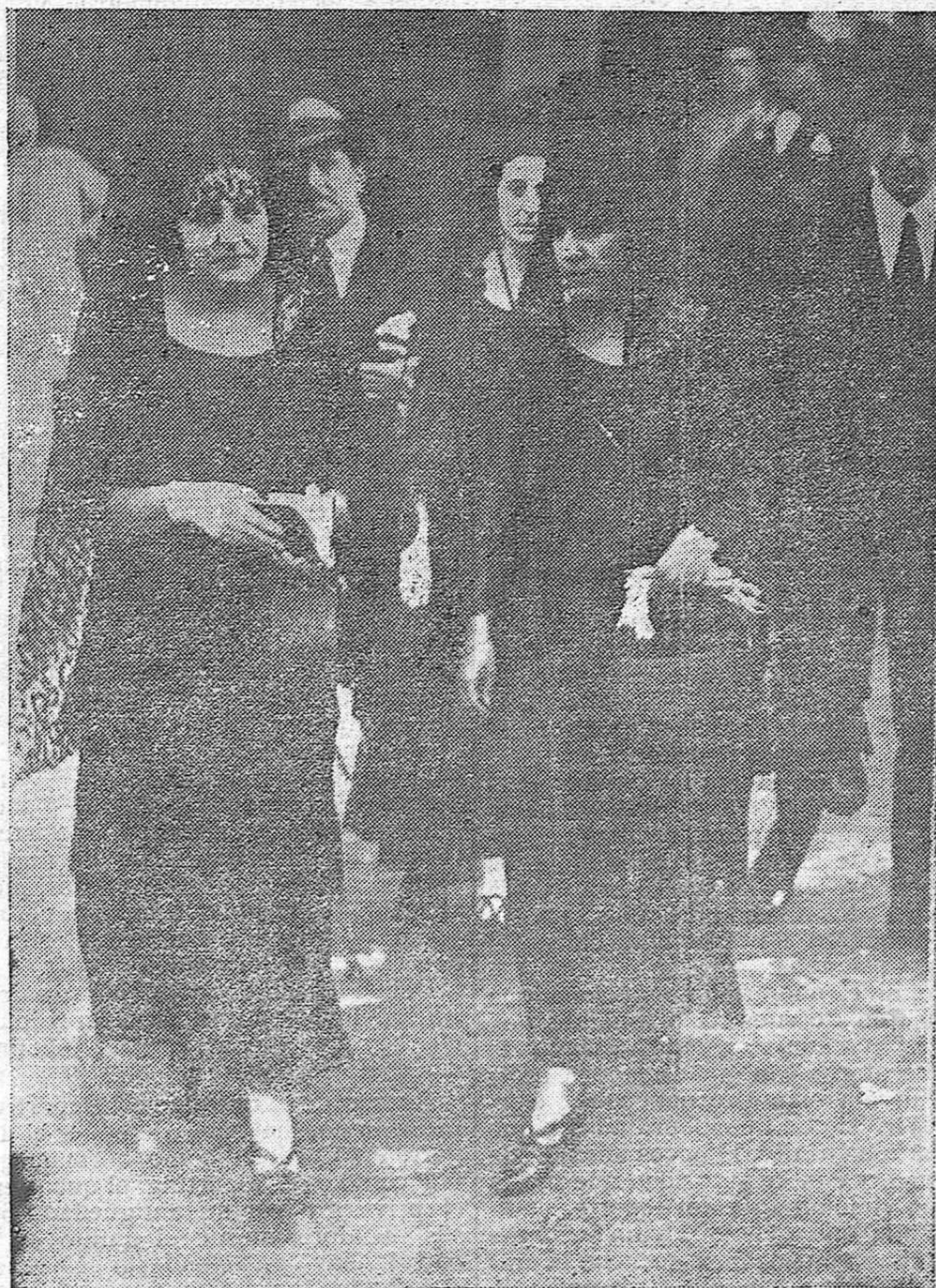
DAMAS DE LA ARISTOCRACIA CORDOBESA, A SU SALIDA DE LA CATEDRAL EN LA TARDE DEL JUEVES SANTO.

Hay que ver el surtido de pañería que tiene EL METRO, lo más nuevo para primavera y verano, artículos buenos a precios bajos.