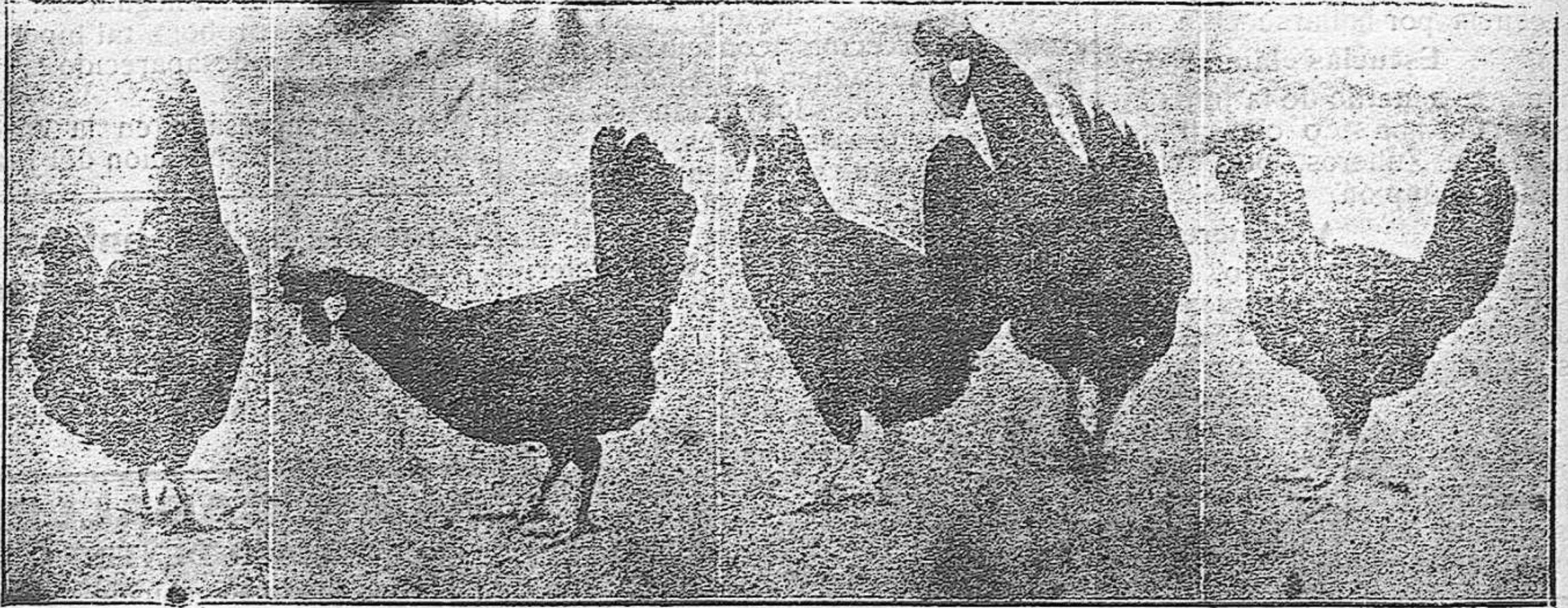
RAZA CASTELLANA NEGRA.

El color de las patas es rosa o amarillo. Este último sólo se podrá fijar en la última variedad de las dos mencionadas, y nunca es muy recomendable, porque no es el propio de la gallina de postura, y desde luego cuando el ave