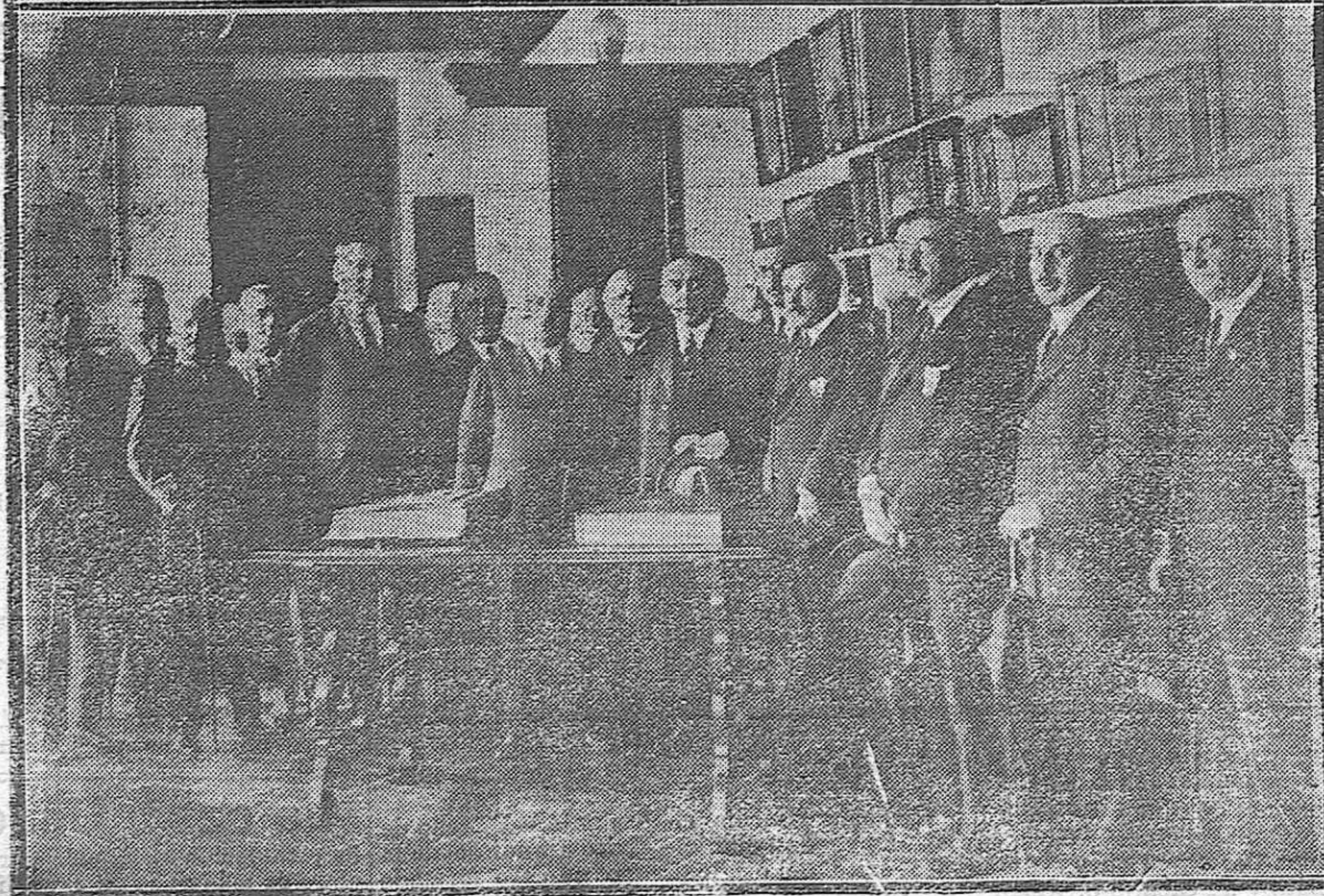
CORDOBA.—1) EL SUBSECRETARIO DE INSTRUCCIÓN PÚBLICA SEÑOR GARCÍA DE LEANIZ, EN SU VISITA A LA ESCUELA MATERNA MODELO.—2) EL SEÑOR GARCÍA DE LEANIZ EN LA INAUGURACIÓN DE LA SALA DE AVILÉS EN EL MUSEO PROVINCIAL.