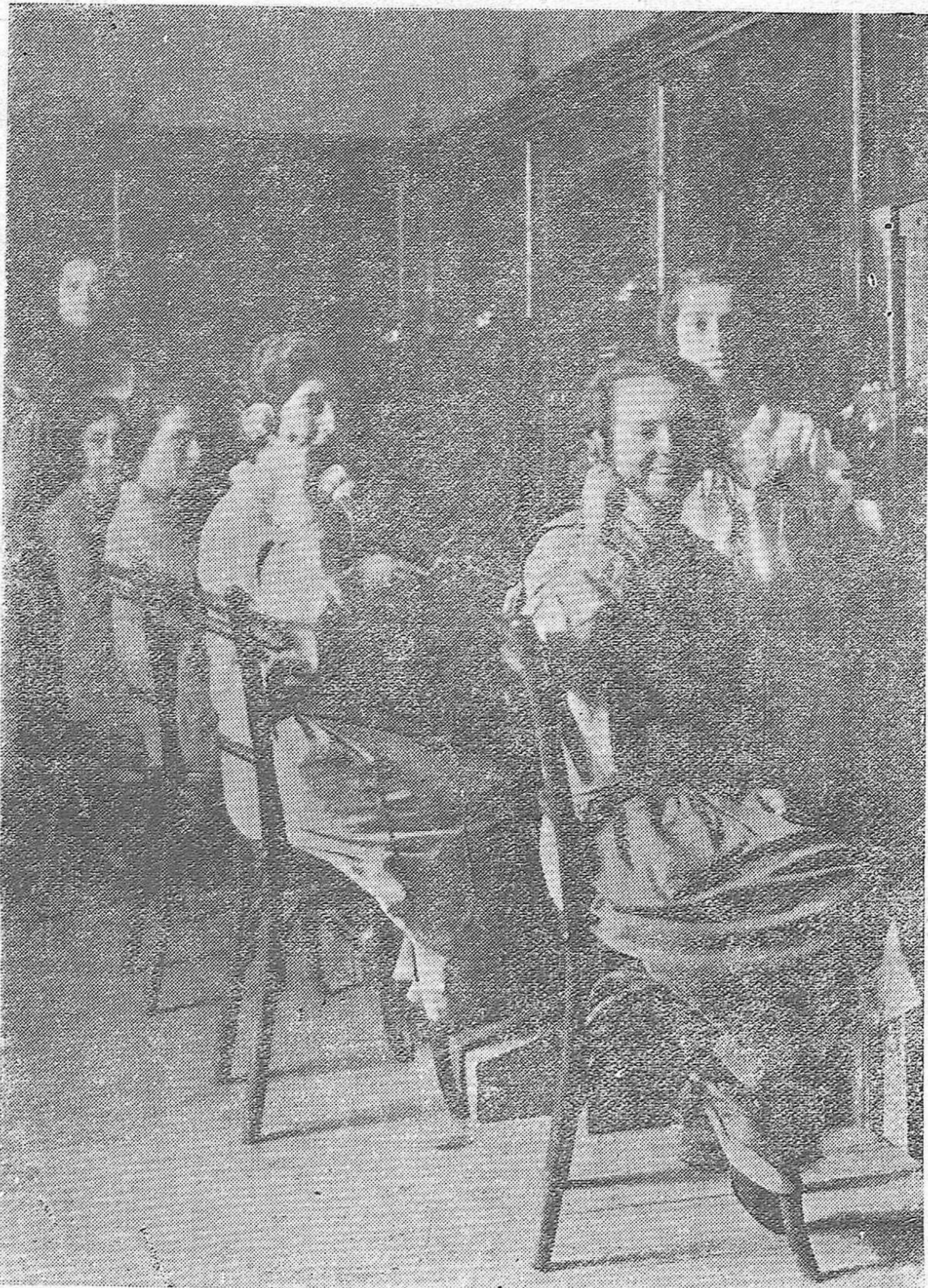
CORDOBA.—CENTRAL TELEFONICA URBANA DE LA CALLE LEÓN TORRELLAS.