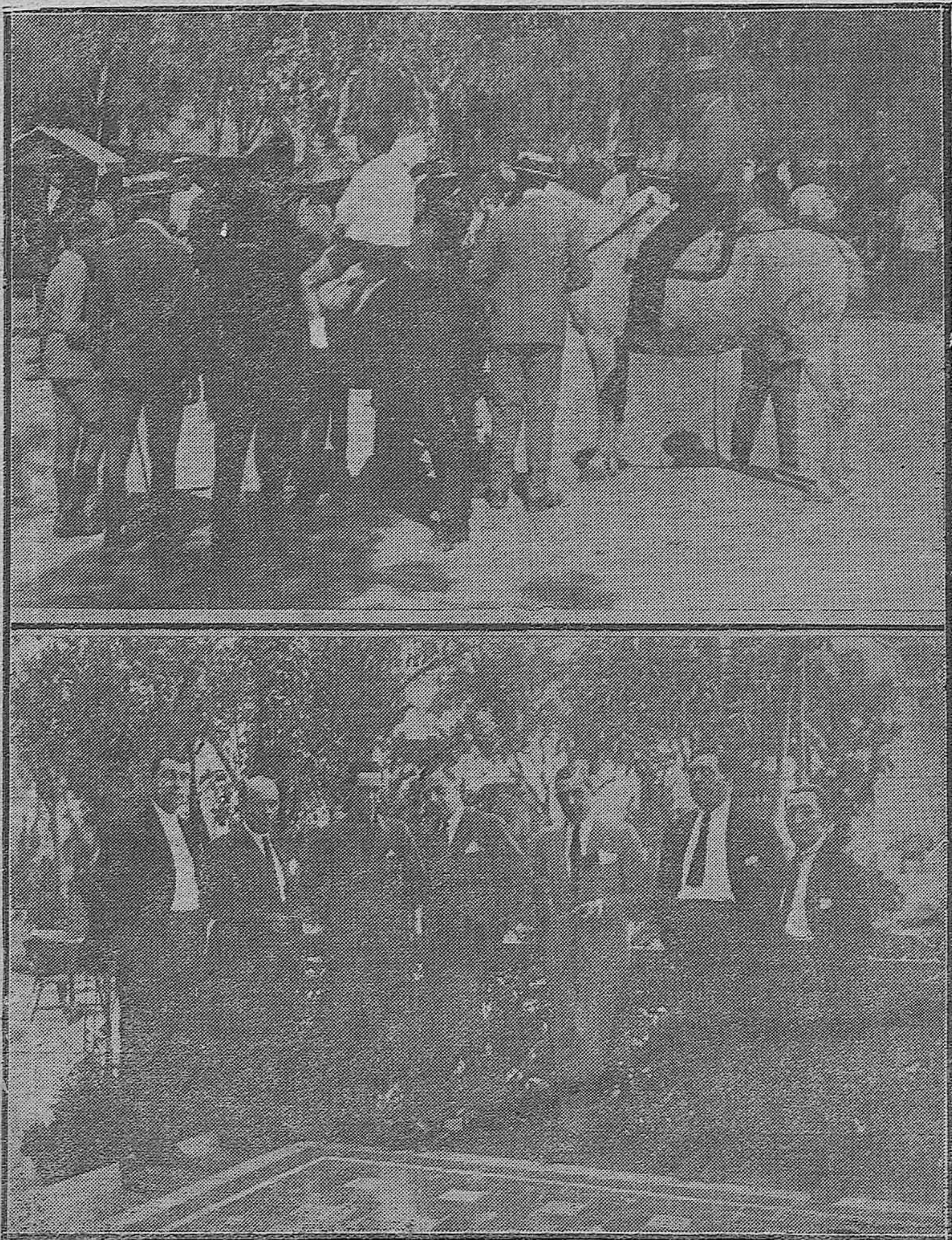
NOTAS DE FERIA.--1) El famoso extorero «Guerrita», con su nieto Pepito, recorriendo el mercado de ganados.--2) El caballero portugués don Ruy da Cámara en la terraza del Regina, rodeado de sus amigos y admiradores.