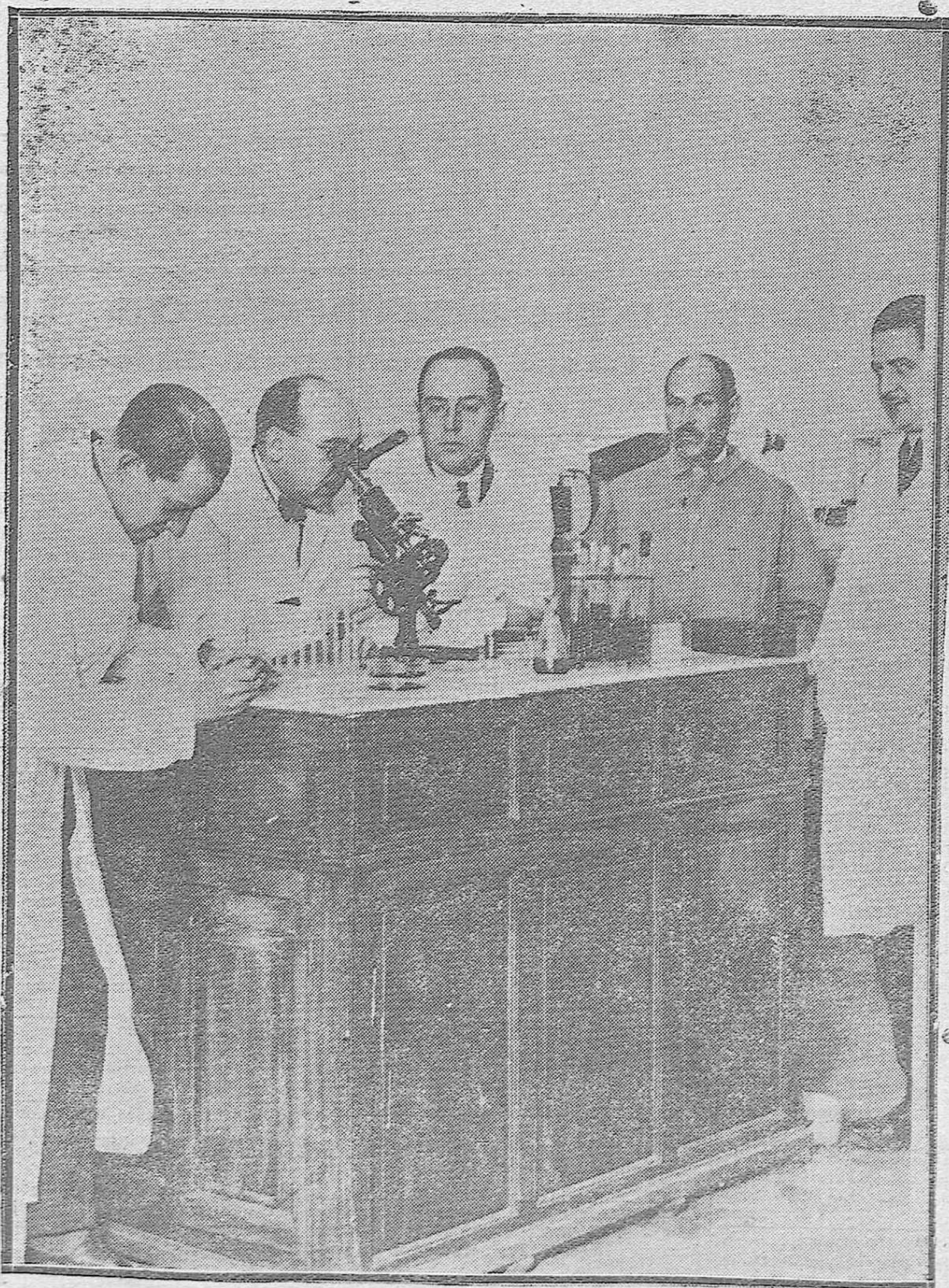
Uno de los grupos de médicos y farmacéuticos que han asistido al cursillo de química y bacteriología celebrado en el Instituto provincial de Higiene.