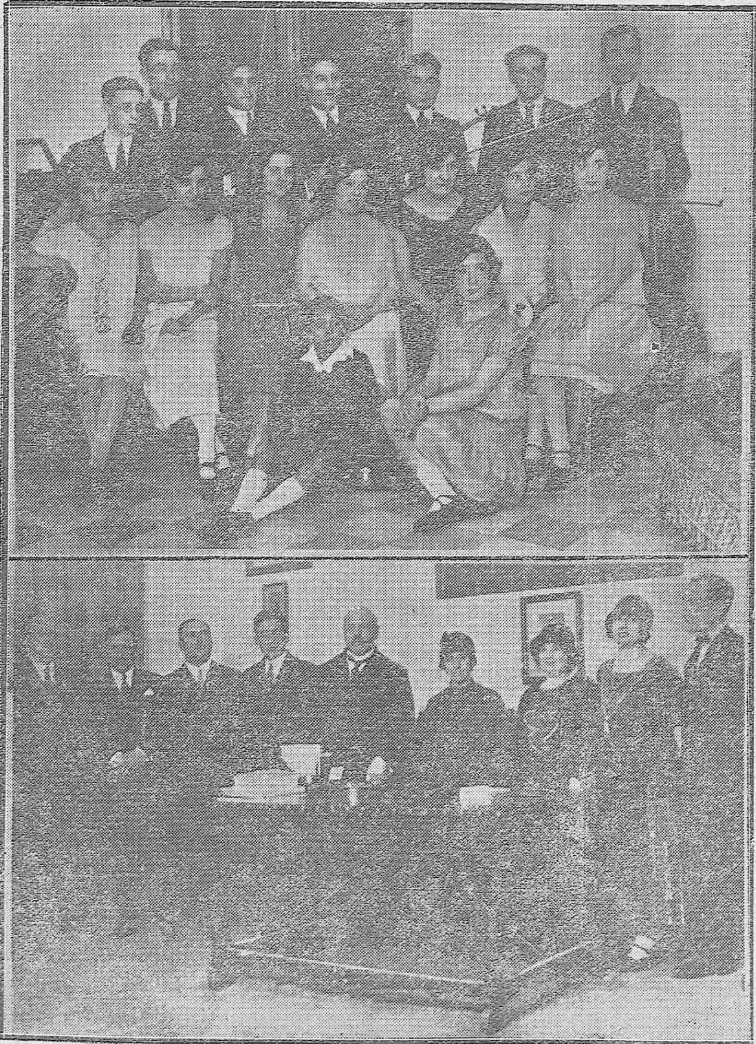
LA FIESTA DE SANTA CECILIA.-1) Alumnos del Conservatorio Oficial de Música que tomaron parte en la fiesta de ayer.--2) Autoridades y profesores del Centro que presidieron el acto.