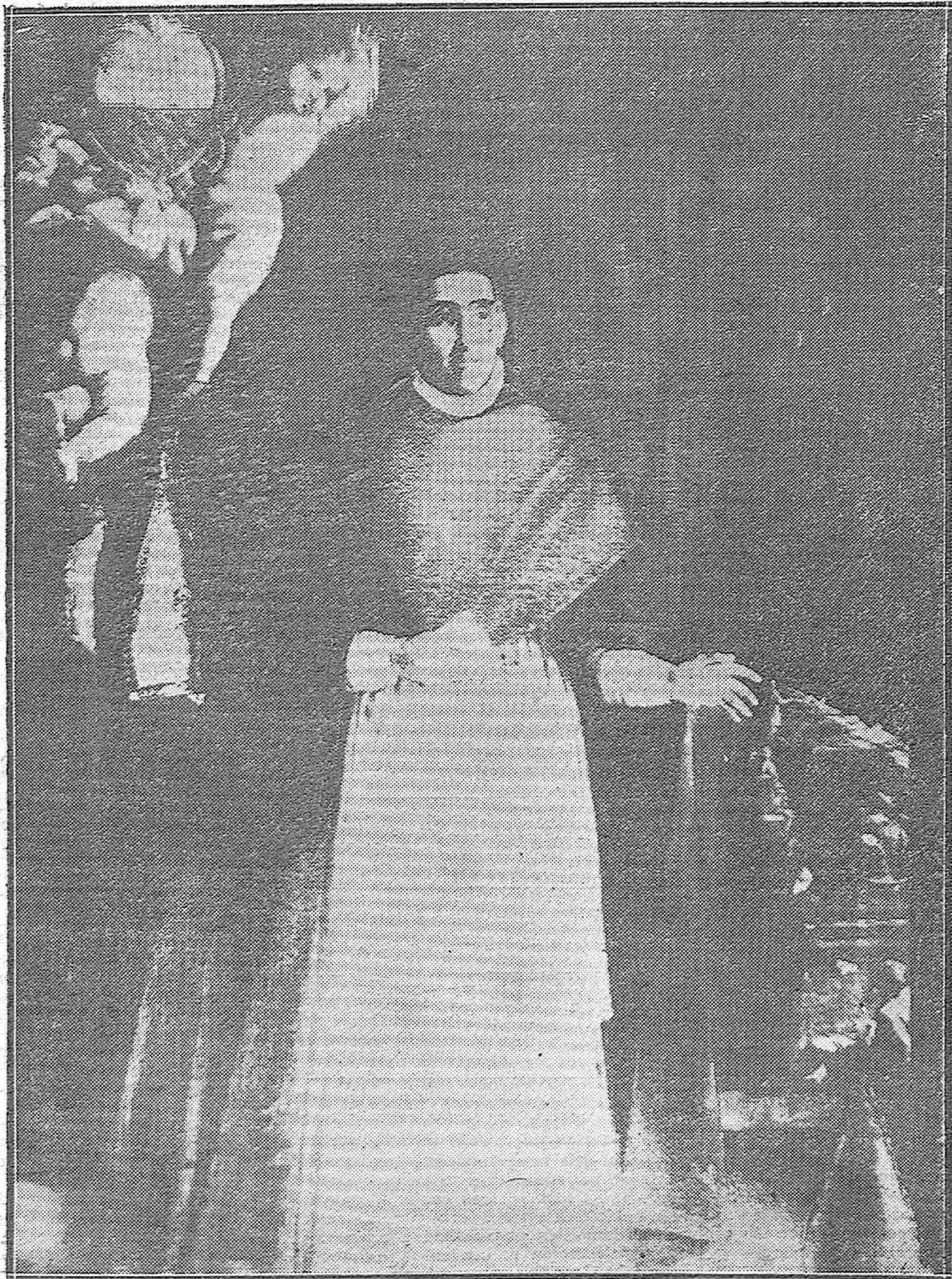
Retrato del Cardenal Salazar, óleo que ha sido hábilmente restaurado por iniciativa y a expensas del señor Cabello Lapiedra, para ser colocado en la escalera del Hospital de Agudos que fundara aquel príncipe de la Iglesia.