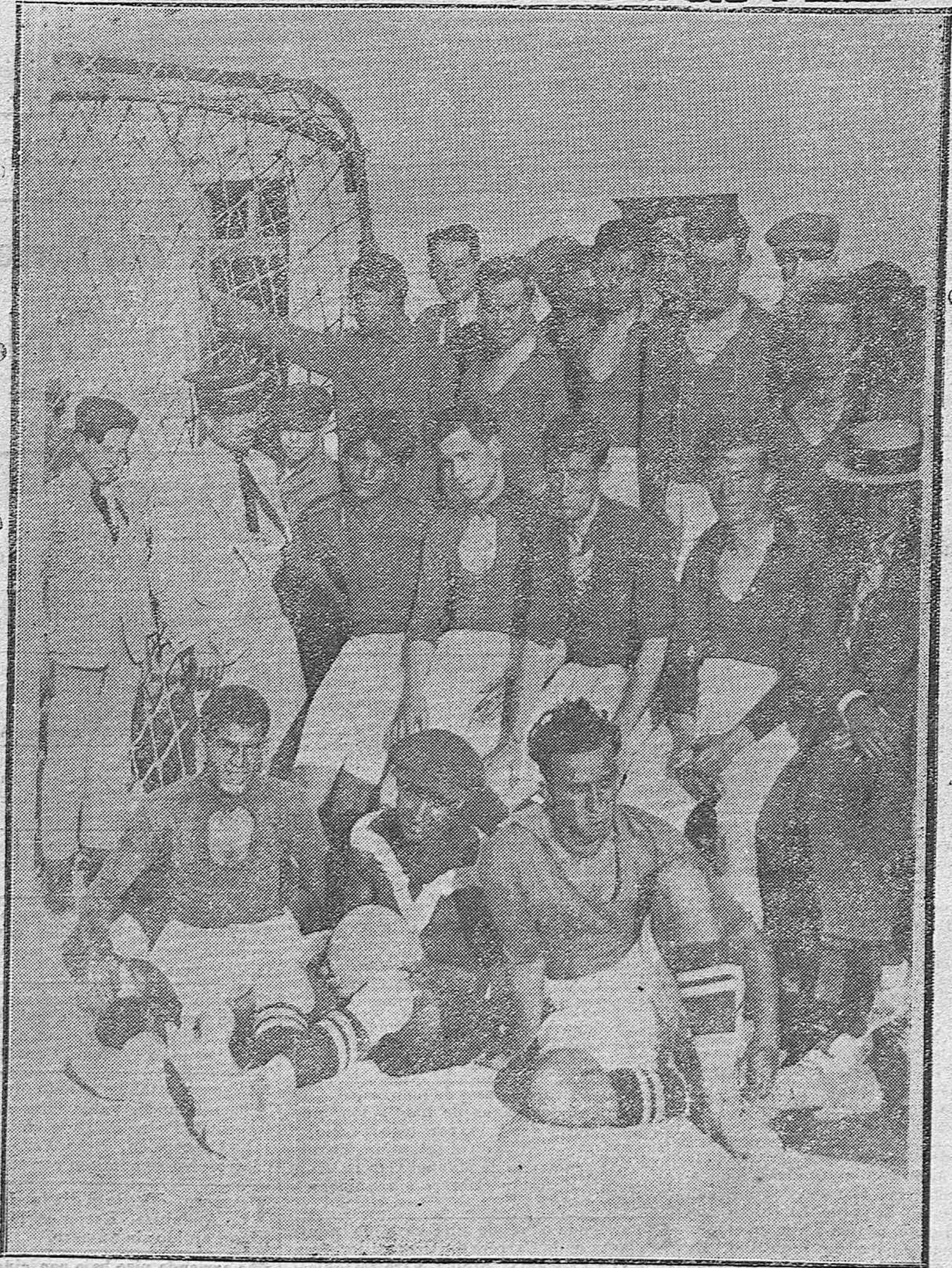
UN PARTIDO DE DESEMPATE QUE NO SE CELEBRA.-- Los «once» del «Algeciras F. C.» que ayer no pudieron contender con los del «Málaga» por no concurrir estos al encuentro.