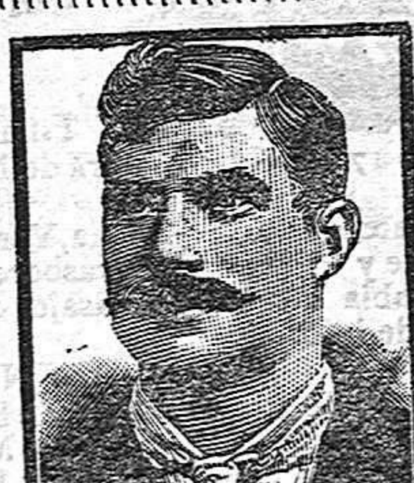
Tarrasa, Calle Media Pasco 46, 8 Marzo 1908.

Para Informes: Centro de Anuncios plaza de Sta. Eulalia, 10.