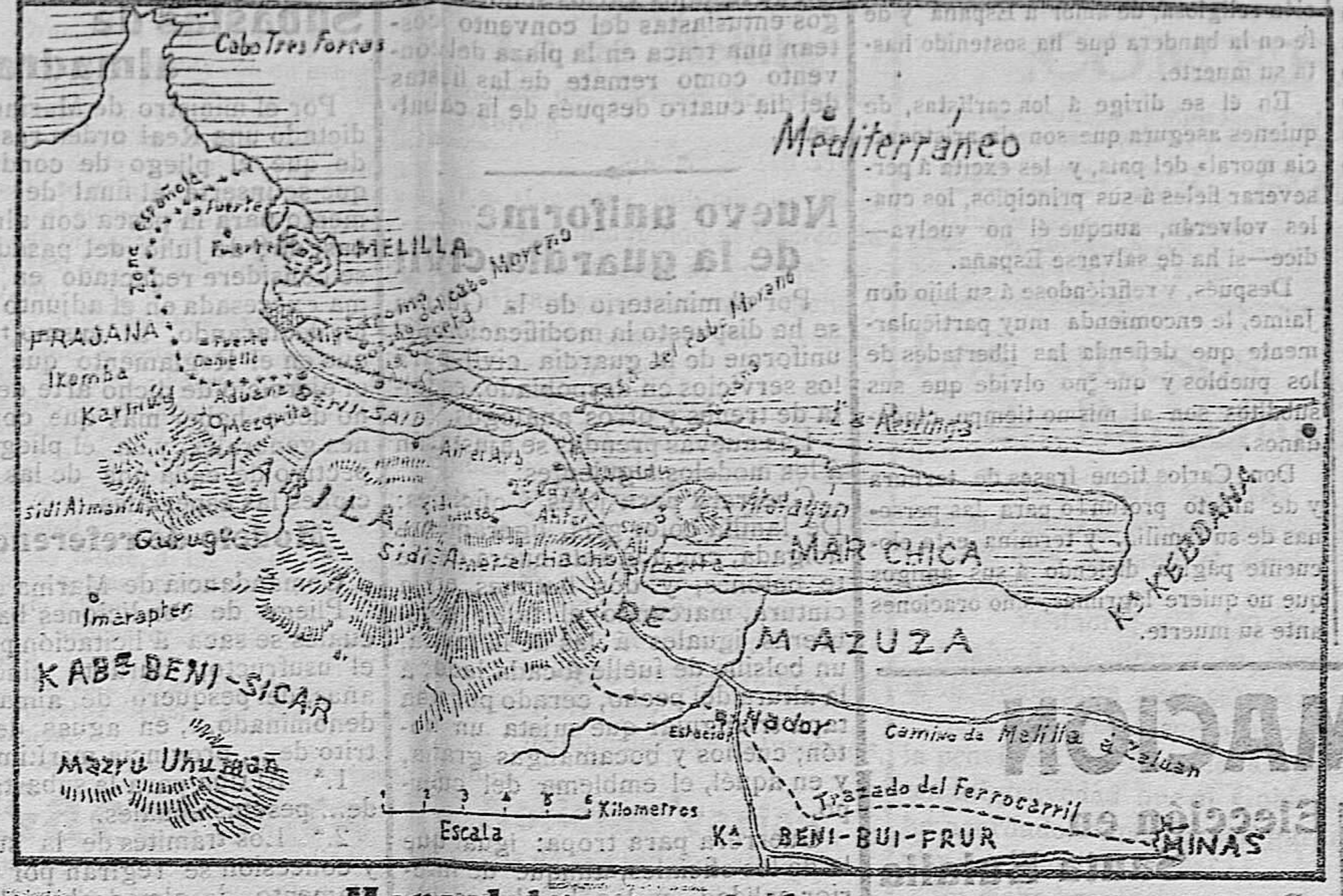
Mapa del teatro de la guerra

Llegada a Coruña. —La recepción.—Caravana automovilista.—Almuerzo en la Diputación. Coruña 24.—A la hora anunciada llegó el tren conduciendo al rey don Alfonso, a su séquito y al señor Maura. En la estación, adonde había acudido el ministro de Marina, representantes en Cortes y todo el elemento oficial, el monarca, que vestía de capitán general, fué cumplimentado por las autoridades, el alcalde y una Comisión de marinos de la escuadra alemana. Al entrar en la estación el tren conduciendo a su majestad la música tocó la Marcha Real, mientras la numerosa asistencia prorrumpe en vivas. Hechas las presentaciones de rubrica, el rey, acompañado del general Aznar, revistó las tropas que rendían los honores. Mientras tanto el señor Maura, a quien acababan de entregar unos telegramas, fué rodeado por varias personas, quienes le pidieron noticias de la guerra, diciéndole que esta mañana habían circulado gravísimos rumores respecto a la situación de las tropas de Melilla. El presidente del Consejo, exhibiendo los telegramas, contestó: «Vean ustedes; el combate ha sido brillante...» Las tropas dispersaron al enemigo, persiguiéndole durante dos kilómetros. Por desgracia, hay que lamentar sensibles bajas...!