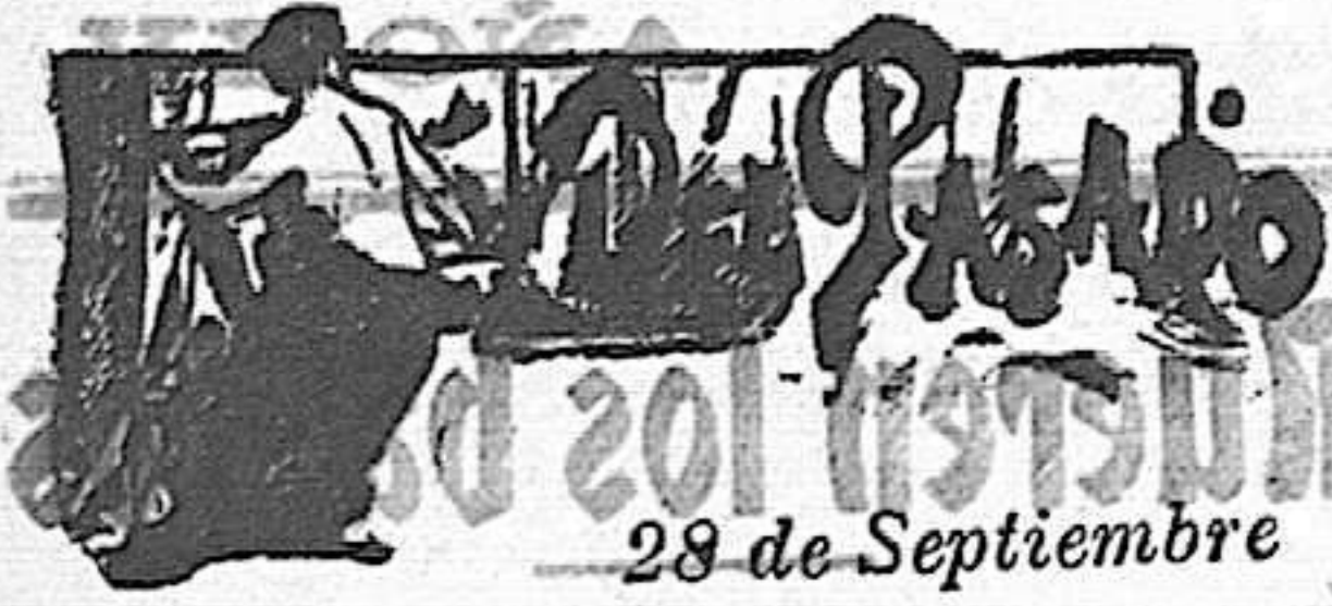
28 de Septiembre

medicamento de gusto agradable y resultados tan rápidos y eficaces que el enfermo aumenta el apetito y las fuerzas casi siempre desde las primeras tomas. Depósito, Diputación 273, Barcelona, y en todas las buenas Farmacias de España y Américas.