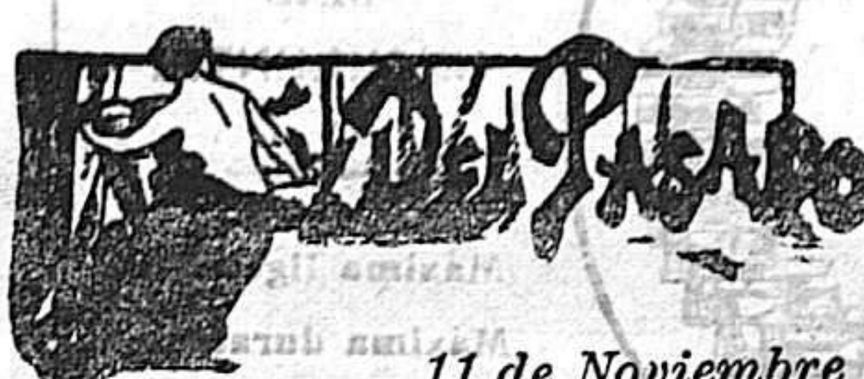
11 de Noviembre

La debilidad nerviosa ó neurastenia, la anemia, la clorosis, convalecencias; dispepsias (pereza de digerir), raquitismo (crecimiento defectuoso) y demás afecciones que reconocen por causa un estado de debilidad general se curan pronto tomando el acreditado