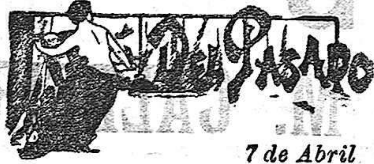
7 de Abril

Reises, según parece, se ha ido á Bélgica en compañía de los 300 000 francos.