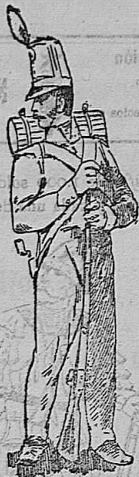
Fusilero de la guerra de la Independencia 1812

En dicho siglo se dividía el ejército, llama-