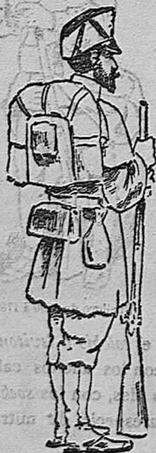
Cazador de 1659 y 60

En 1503 y 1504, los Reyes Católicos mejoraron las condiciones orgánicas de la infantería, y entonces fueron suprimidas las tropas feudales y de acostamiento, estableciéndose que se hicieran por decreto real los reclutamientos y que se dividiese por mitad su ar-