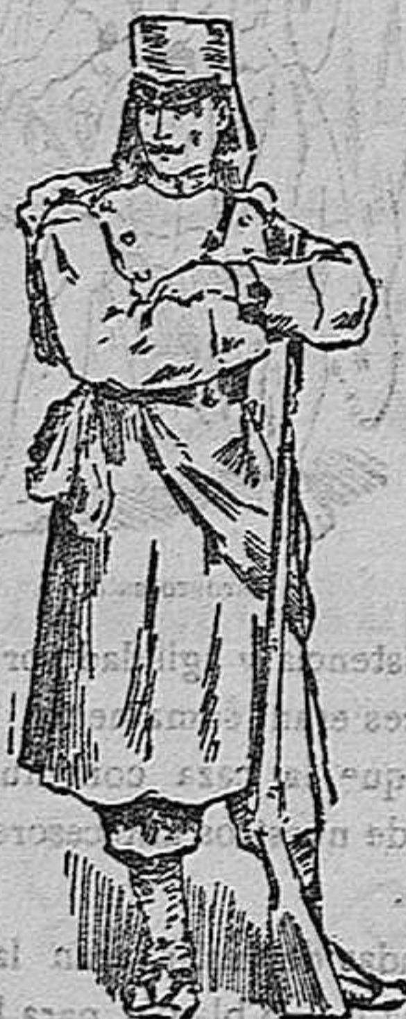
Soldado de la Infantería actual

En los comienzos del siglo XIX, se llevaron á efecto diversas reformas aconsejadas por los adelantos, introducidos en el arte de la guerra. En 1805 se aprobó el uniforme blanco para la infantería, no obstante lo cual, durante los primeros años de la guerra de la Independencia reinó un verdadero caos en cuestión de uniformes, á consecuencia de que todo hom-