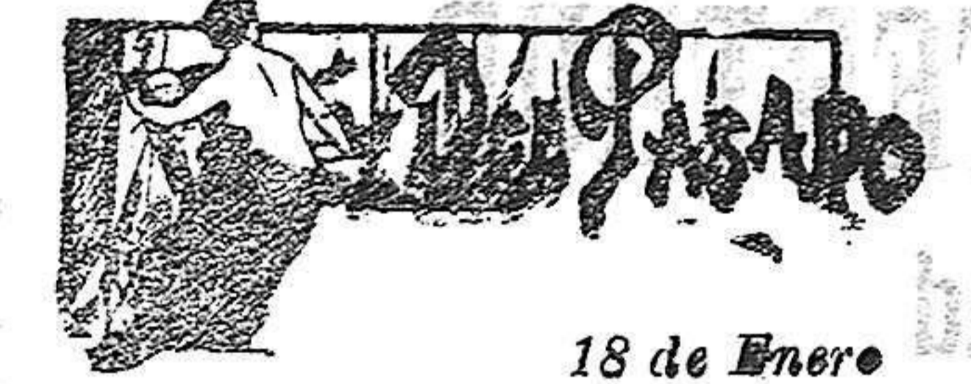
18 de Enero