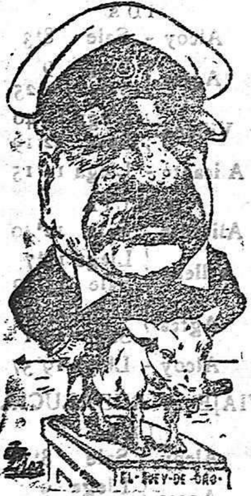
Pierpont-Morgan (El Rico)

Los millonarios americanos, salvo raras excepciones, empezaron su carrera miserablemente. La historia extraordinaria de sus fortunas ha ocupado las columnas de los periódicos neoyorkinos, asombrando su relato á los lectores.