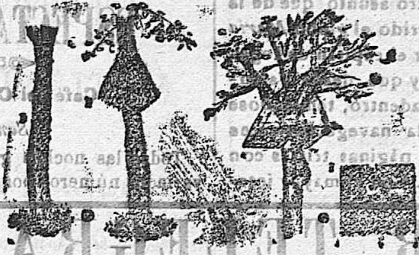
Modo de impedir á los gatos la destrucción de los nidos en los árboles frutales

Como no puede negarse que los pajaros son los auxiliares naturales de los agricultores, por su calidad de insectívoros, deber es del Estado, no solamente fomentar su propagación, sino atender á protegerlos de las acometidas de otros animales, que, cual los gatos, persiguen sus nidos con veridica saña, agitando en sus crías las especies más necesarias.