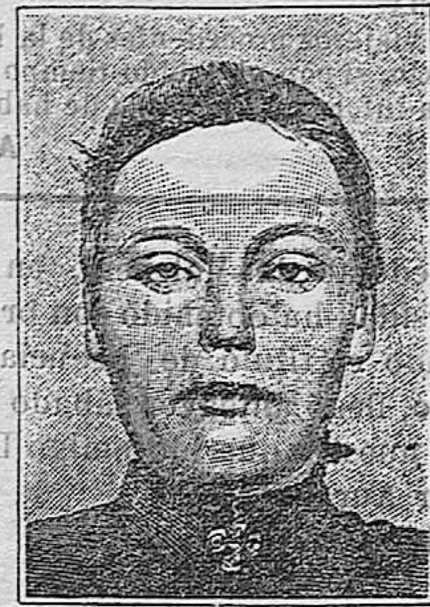
Después de 15 días de tratamiento