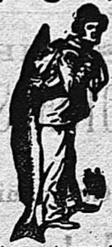
Obténase siempre la Emulsión con esta marca "El Pescador" marca del procedimiento Scott!

de aceite de higado de bacalao é hipofosfitos de cal y de sosa, tres veces mas eficaz, rápido, y seguro, y por lo tanto realmente económico, además no tiene el mal sabor ni olor de aquel y jamás repite.