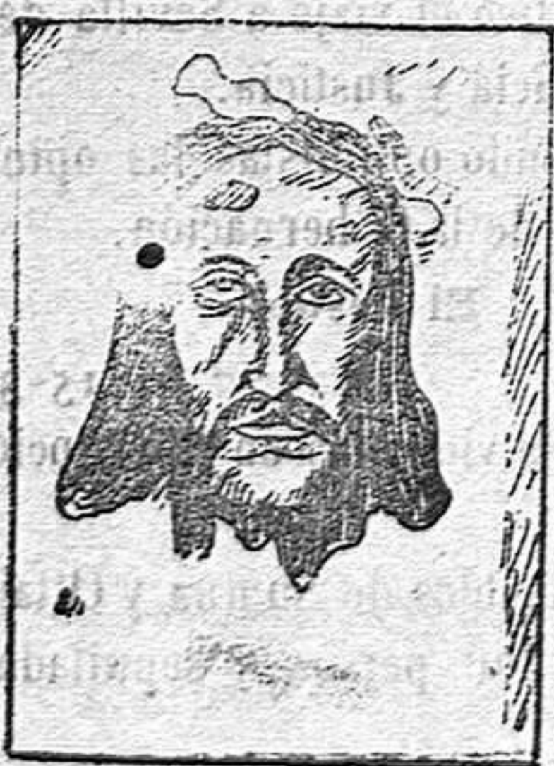
El Sagrado Rostro llamado del Rey Abgar (En la iglesia de San Bartolomé, de Génova)

«En este tiempo apareció un hombre que vive todavía y que está dotado de un grandísimo poder; su nombre es Jesús. Sus discípulos le llaman Hijo de Dios; los demás le miran como un poderoso profeta. Vuelve los muertos á la vida; cura á los enfermos de toda clase de padecimientos y angustias. Este hombre es de elevada estatura y bien proporcionado; su fisonomía es severa y dulce, tanto