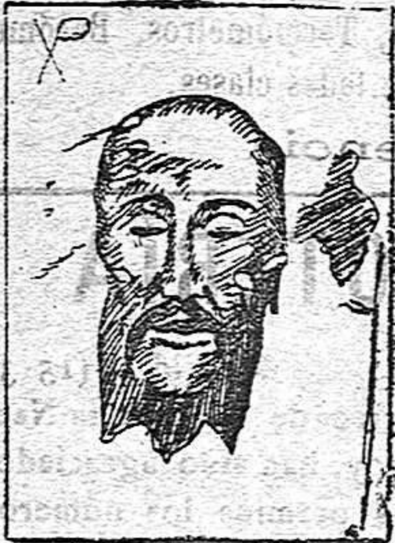
Santísimo Sudario de la Verónica (En la iglesia de San Pedro, en Roma)

Una de las imágenes de Jesús que ha adquirido mayor celebridad es la que se conoce con el nombre de «Santísimo Sudario de la Verónica». Dice la narración piadosa, que marchando Jesús por la calle de la Anargura, camino del Calvario, sudando sangre bajo el peso de la colosal cruz, cayó delante de la casa de una piadosa mujer, llamada Verónica, la que, compadecida, le ofreció un lienzo para que se secase el rostro, cubierto de polvo, de sudor y de sangre, y livido por los golpes y por los azotes recibidos. Jesús aceptó aquél ofrecimiento, y como recompensa de tan piadosa acción le devolvió el lienzo con su sagrada imagen en él estampada.