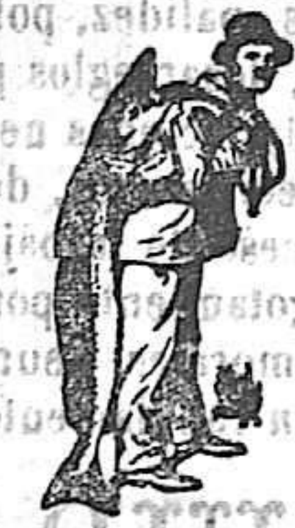
Obténalo siempre la Emulsión con esta marca "El Pescador", marca del procedimiento Scott.