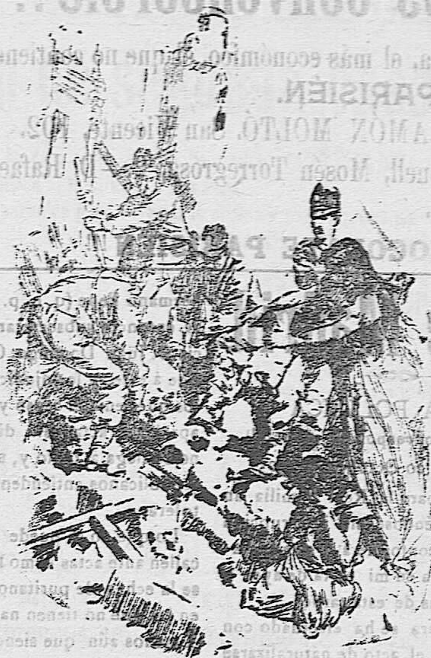
Buscando los cadáveres entre las ruinas

De día en día reviste mayores proporciones la terrible catástrofe ocurrida en Calabria. Las noticias que van llegando del interior de aquellas montañas, donde ni ferrocarriles, ni aún carreteras existen para comunicarse con el resto de Italia, son conmovedoras. Por eso en dichas montañas la acción de las autoridades para auxiliar a los damnificados ha sido tardía, y sólo gracias á la valiente actitud de algunos periodistas han logrado los habitantes alcanzar algún socorro. La autoridad militar superior de la provincia tardó mucho en acertar á resolver el problema de socorrer á tantos desgraciados. El enviado especial del periódico «El Secolo», Aristides Polastri, telegrafió á su periódico, que en aquellas montañas se había empezado á sentir el hambre, sumándose á él un brusco cambio de temperatura que hacía presagiar más horrenda