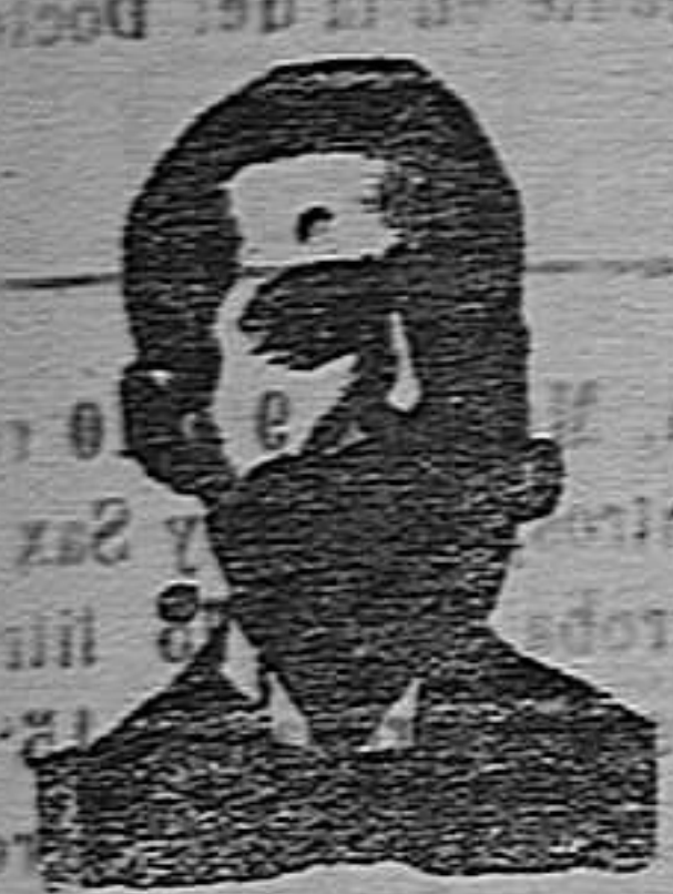
A. SALVATI COSTANZI CALLE DIPUTACION, 349 BARCELONA

Consultas médicas en Barcelona calle Diputación, 349, entresuelo 2.º, todos los días, miércoles y viernes, a las 19.